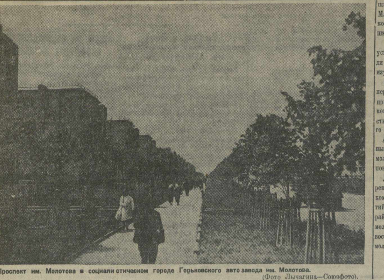
Проект им. Молотова в социалистическом городе Горьковского автозавода им. Молотова.