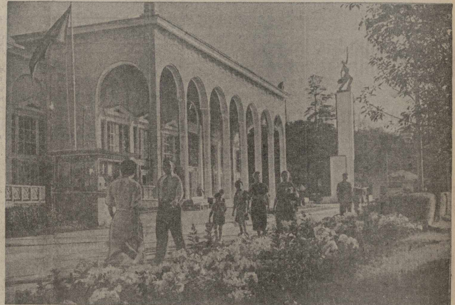
Павильон печати на Всесоюзной сельскохозяйственной выставке.

В Москве 20 августа вечером открылось совещание актива работников Народного Комиссариата Юстиции СССР. В работе совещания принимают участие члены Верховных и областных судов, наркомы юстиции союзных республик, судебные работники многих городов и областей Союза.