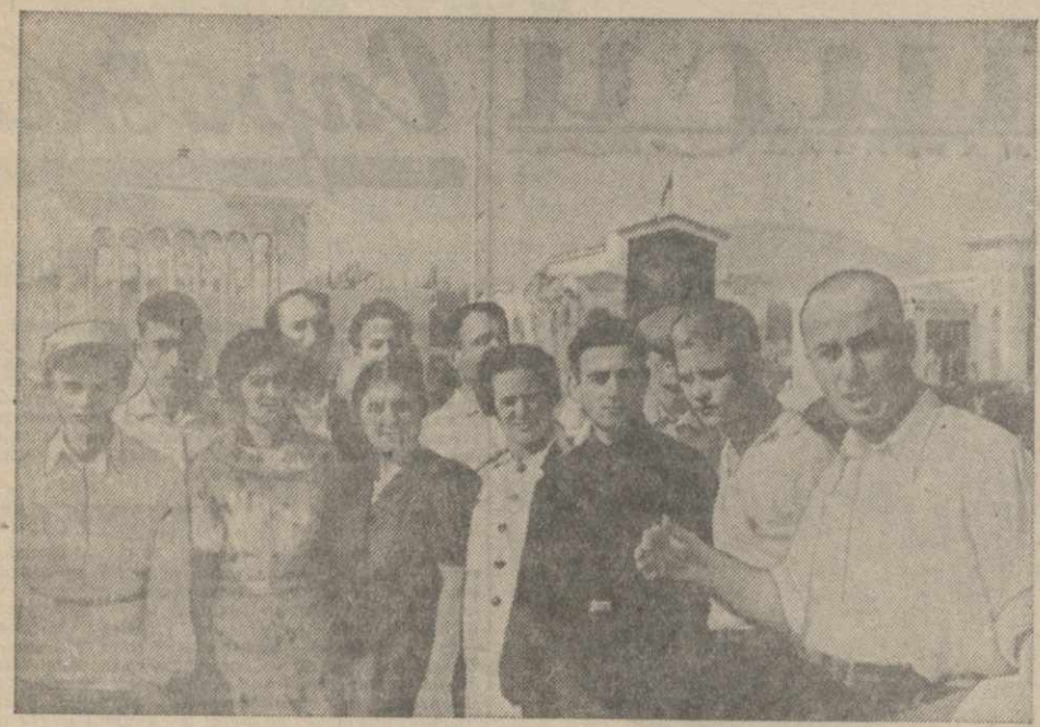
Экскурсия станицевцев г. Батуми на Всесоюзной сельскохозяйственной выставке.