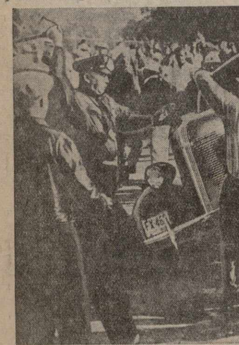
Во время забастовки в Иллианде (США) произошел ряд столкновений между бастионами рабочими и полицией...

композиции, извинения властей селтментов и передачи марионеточным властям полицейских прав на внешней территории международного селтмента.