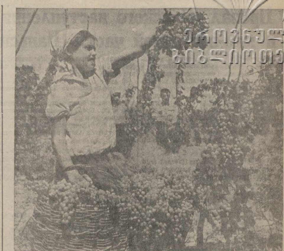
Сбор винограда в колхозе имени Махарадзе.