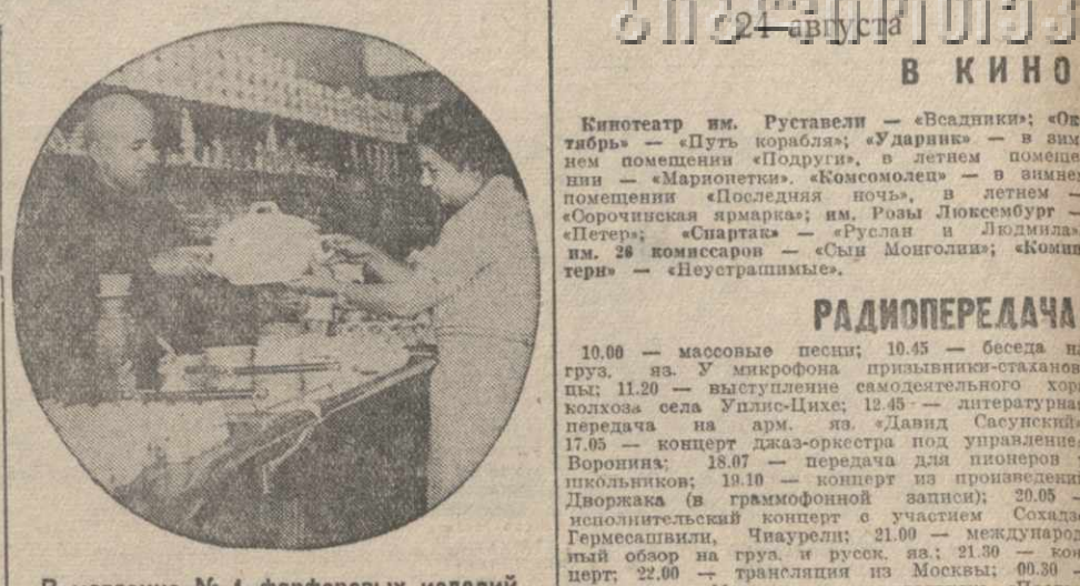
В магазине № 1 фарфоровых изделий.

Коммунальный отдел Тбилисского Совета составляет технический проект прокладки по улице Монтана (район имени Ленина) двухпутного трамвайного пути.