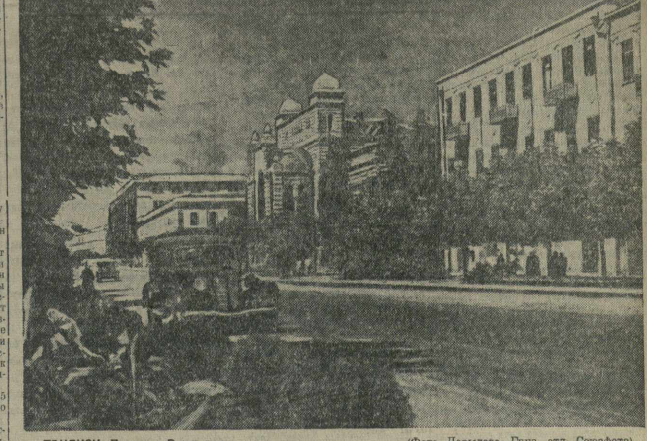
ТБИЛИСИ. Проспект Руставели.

Во втором туре Ржещевскому вновь удалось одержать победу: на этот раз он выиграл у Элиаскаеса. Партии Файн — Флор, Петров — Капабланка и Рагозин — Керес закончились ничью.