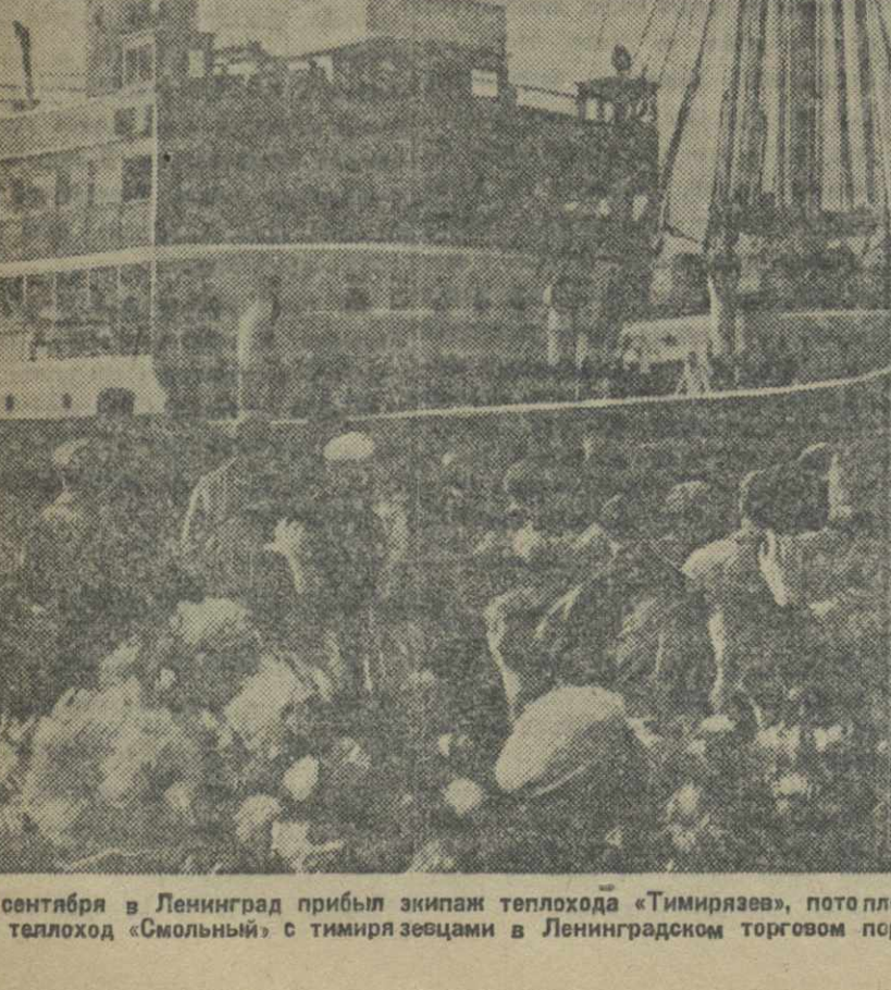
12 сентября в Ленинград прибыл экипаж теплохода «Тимирязев», потопленного итальянскими фашистами в Средиземном море. На снимке: теплоход «Смолюный» с тимирязевцами в Ленинградском торговом порту.

УФА. 16. (ГТА). Колхоз «Путь Ленина», Иглинского района, с 20-е число октября готовит подарки своим колхозникам, находящимся в рядах Красной Армии. В дни праздников все 14 красноармейцев этого колхоза получат ценные подарки.