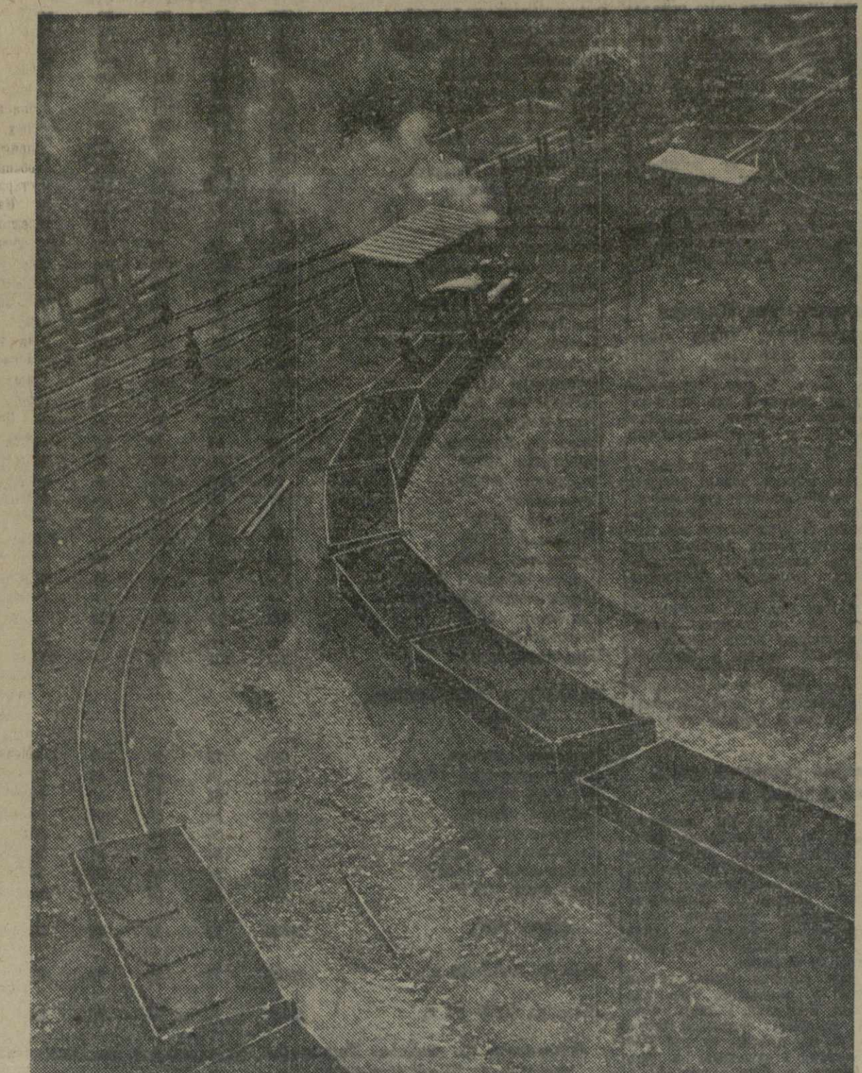
Чиатура. На фото: нагруженный марганцем состав узкоколейной жел. дороги Чиатура — Шорапани.