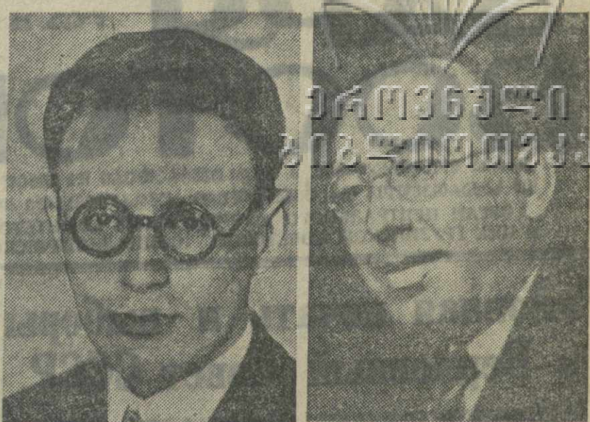
Гроссмейстер М. М. Ботвинник. Чемпион СССР Г. Я. Левенфиш.

МОСКВА, 4. (ТАСС). Вечером 4 октября в гостинице «Националь» состоялся шахматный матч за первенство СССР — М. М. Ботвинника и Г. Я. Левенфиша.