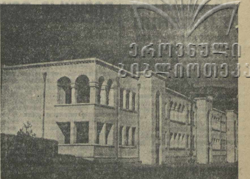
Г. Чинтура, Новый дом для стакхановцев.

Массовые консультации по отдельным вопросам Дом партпросвещения провел также в порту, Грузавтогосте, на кондитерской и табачной фабриках, хлебопекарне.