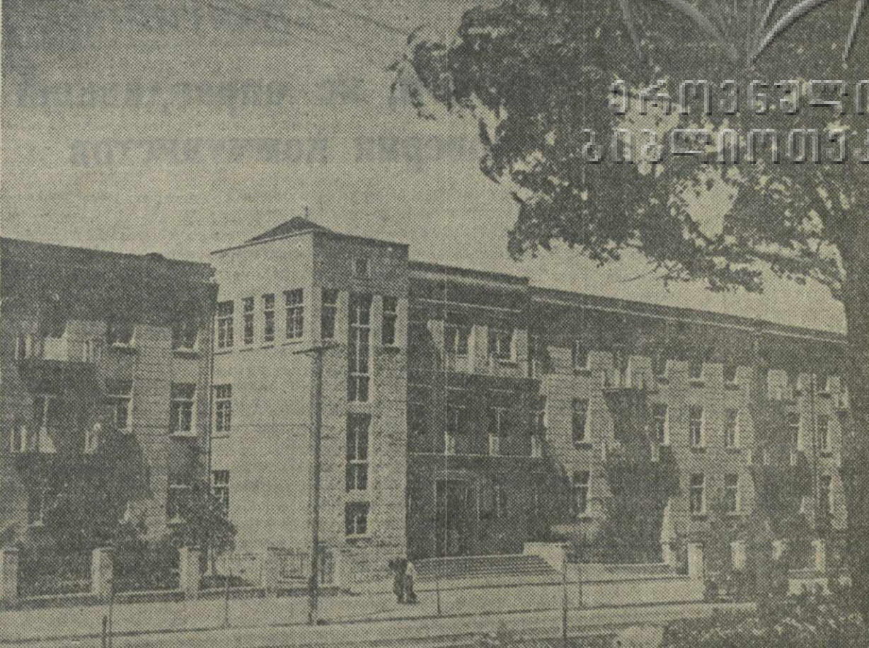
Новый лечебный комбинат Наркомздрава Грузинской ССР в Тбилиси. Комбинат оборудован по последней слову медицинской техники. При комбинате имеется стационар на 100 койек и поликлиника с пропускной способностью 1.000 человек в сутки.

В полях получения новых ценных морозостойких форм эвкалиптов, питомник проявил выносливость эвкалиптов австралийских и местных сортов эвкалиптов. Уже получено до 40 гибридных комбинаций.