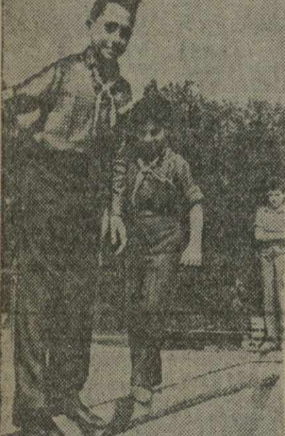
Испанские дети в Центральном Парке культуры и отдыха им. Горького в Москве.

Одновременно в Испанию отправляются самолеты, авиационные батареи, танки и военное снаряжение.