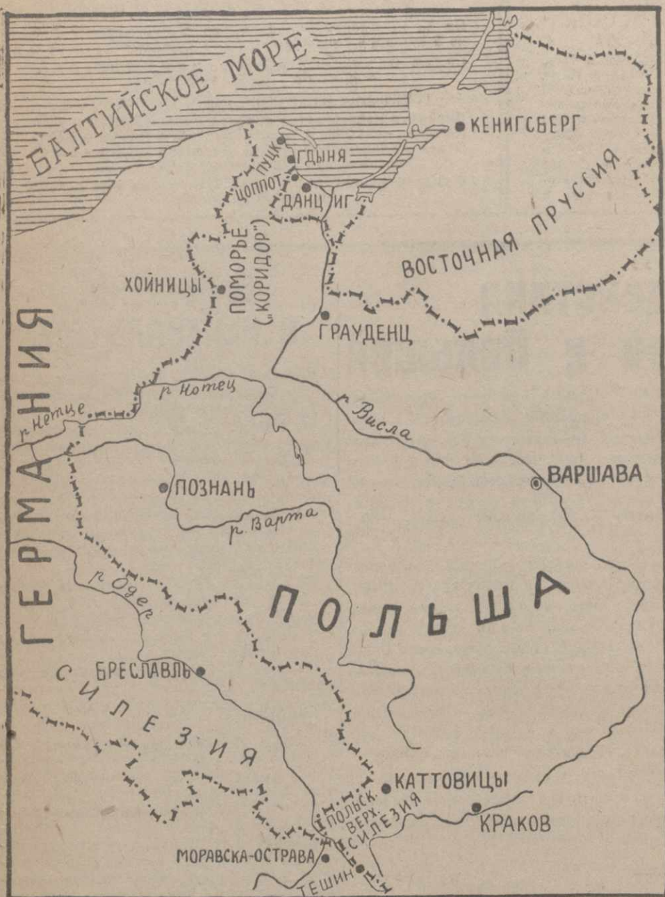
К военным действиям между Германией и Польшей.