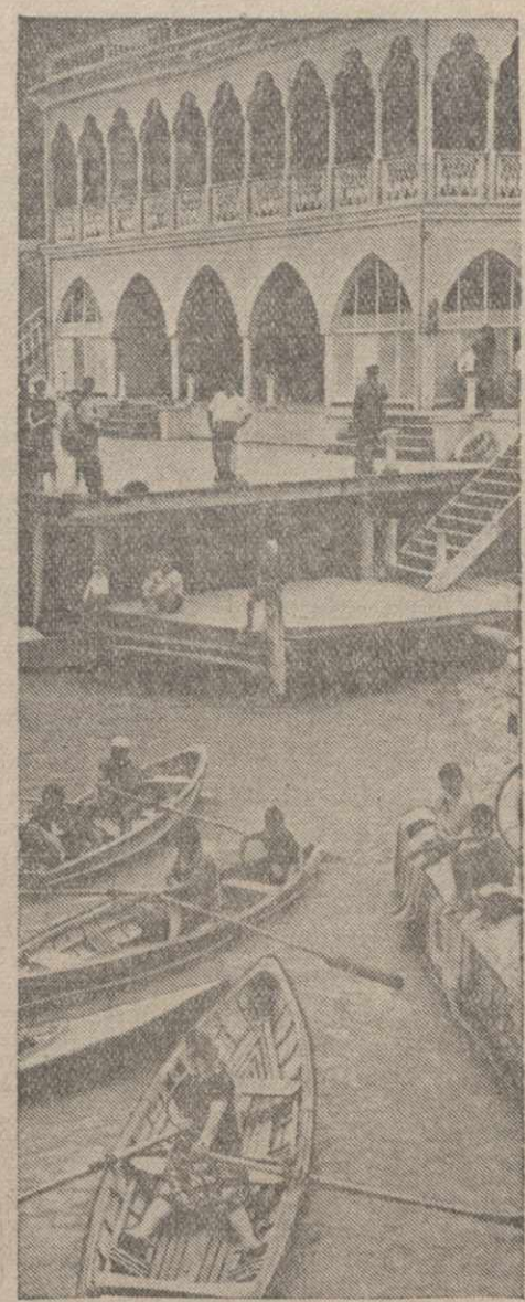
В выходной день на Мцхетской водной станции. Фотохроника ГТА.

В лаборатории подвергаются также специальной обработке особо ценные предметы, которые необходимо предохранить от разрушения. Сейчас в лаборатории обрабатываются находки археологической экспедиции в Мхета-Самтавро.