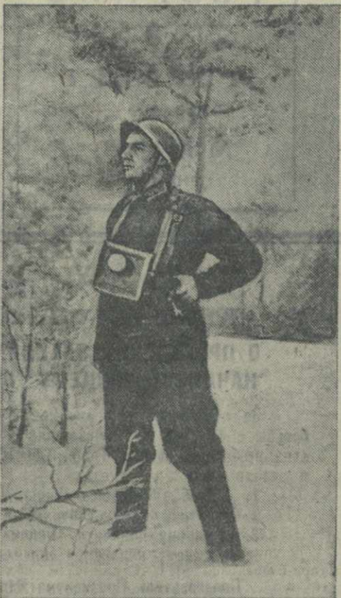
Портрет Героя Советского Союза капитана И. С. Угрюмова работы художника В. Н. Пчелина.

● 4 февраля агентство Юнайтед пресс из Бирмингема (Англия), полиция разогнала там толпы людей, пытавшихся проникнуть в угольные склады, чтобы погнать топливо. Большие толпы людей пытались захватить уголь в городе Астон (около Бирмингема).