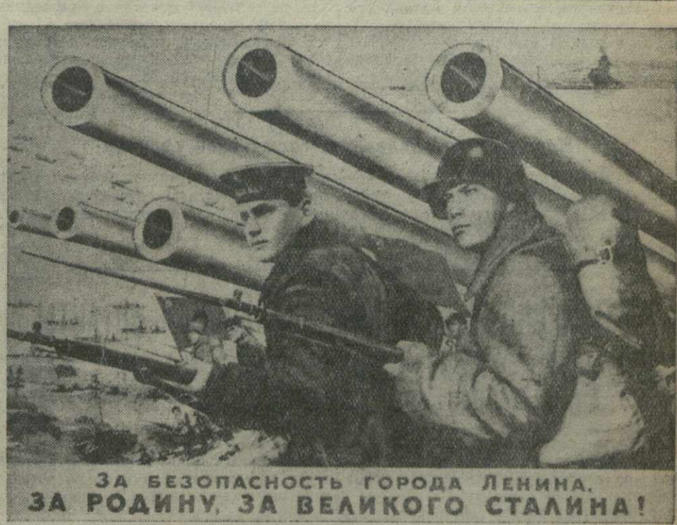
За безопасностью города Ленина, за Родину, за великого Сталина!

Рабочие завода имени Орджоникидзе послали товарищу Паланину приветственное письмо. (ТАСС). КИРГИЗСКОЕ — 86,6. Вынесены по подписке на заем досрочно поступают также в Каракалпакской и Крымской АССР, Бухарской, Ташкентской, Самаркандской, Курганской, Ферганской и других областях. (ТАСС).