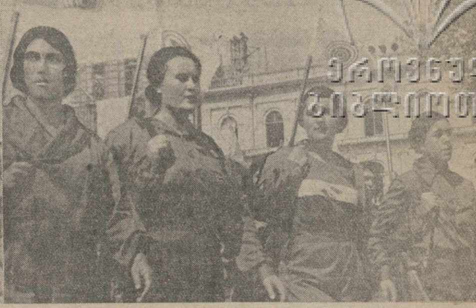
Празднование XXV Международного юношеского дня в Тбилиси. На снимках: слева — колонна студентов Тбилисского техникума физкультуры имени Л. П. Берия; справа — группа девушек-спартинок спортивного общества «Спартак».