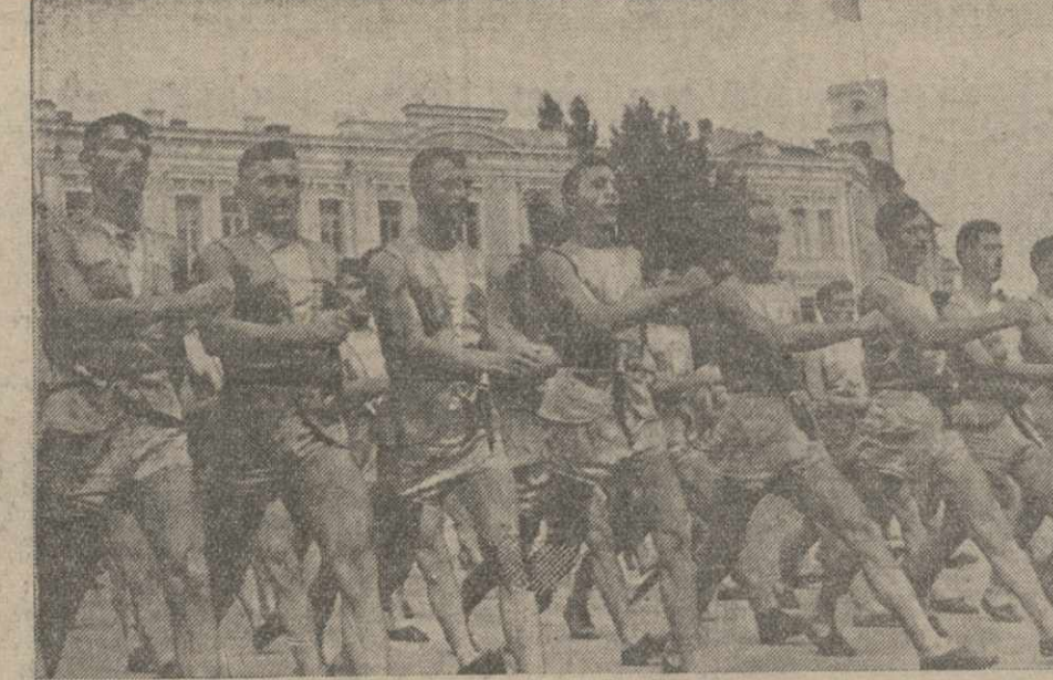
Празднование XXV Международного юношеского дня в Тбилиси. На снимках: слева — колонна студентов Тбилисского техникума физкультуры имени Л. П. Берия; справа — группа девушек-спартинок спортивного общества «Спартак».

В связи с кампанией по выборам в местные Советы депутатов трудящихся, первичные партийные организации должны шире развернуть массово-агитационную работу.