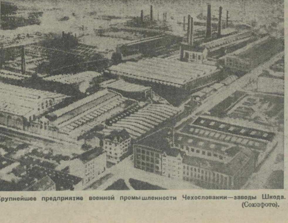
Нрупнейшее предприятие военной промышленности Чехословакии—заводы Шкода.