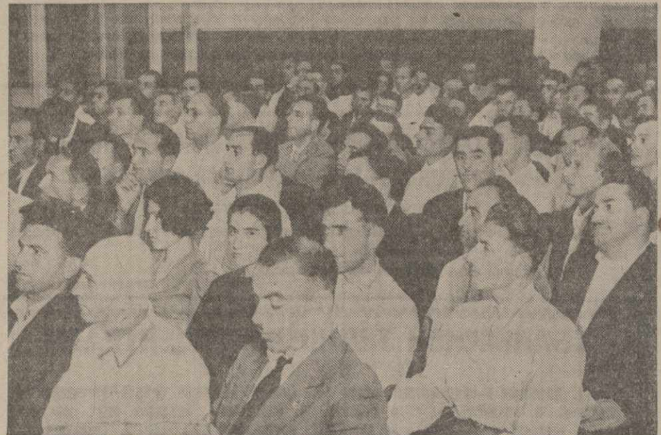
20 сентября в Доме учителя открылось республиканское совещание по пропаганде и агитации. На снимке: участники совещания.

Организовать систематическую самостоятельную политическую учебу наших кадров, оказать им всемерную помощь в овладении марксистско-ленинской теорией — вот вывод товарищей, выступивших на совещании.