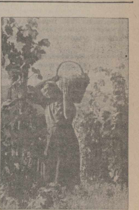
Сбор винограда в колхозе им. Мехардзе.

По заключению специалистов — виноградарей, сахаристость винограда достигает 18—20 процентов. Это говорит о том, что Кварельский район в этом году даст вино наилучшего качества.