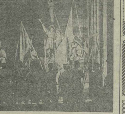
«Богдан Хмельницкий» в театре имени Руставели. Финал второго действия.

11 и 12 марта Грузинская филармония проводит вечера художественного чтения лауреата Всесоюзного конкурса мастеров художественного слова Антоны Шварца.