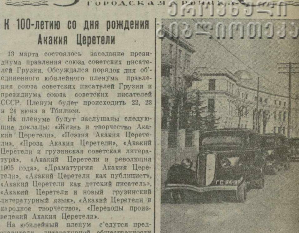
Тбилиси. Вид на улицу Марра.