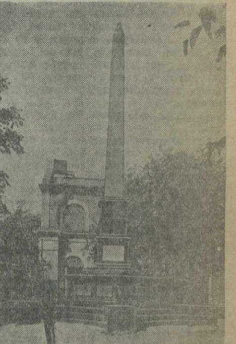
Завод имени СТАЛИНА. Обелиск, на котором отмечены годы революционной работы товарища СТАЛИНА среди рабочих Главных мастерских Закавказских железных дорог, (1898—1901 гг.).

План по выпуску паровозов из ремонта выполнен в январе на 104 процента и в феврале на 104 процента. По пассажирским вагонам в январе и феврале план выполнен на 100 процентов; по товарным вагонам в январе план выполнен на 102,3 процента, в феврале — на 101,6 процента; по электровозам в январе — на 100 процентов и в феврале — на 200 процентов.