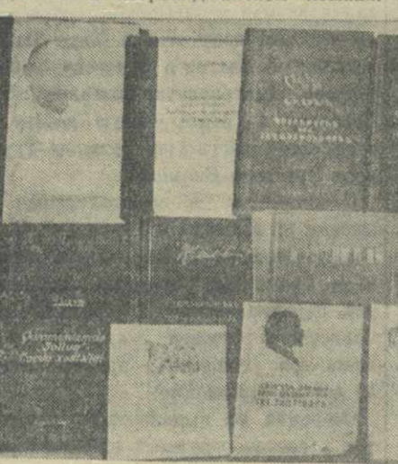
Произведения Владимира Ильича Ленина читаются и изучаются миллионами трудящихся. На снимке: произведения В. И. Ленина, изданные на языках народов СССР.

На грузинском языке вышло 117 работ В. И. Ленина тиражом 973.350 экземпляров, на русском языке — 10 работ тиражом — 22.000 экземпляров, на абхазском — 2 работы тиражом в 3.200 экземпляров, на осетинском — 7 работ тиражом 12.550 экземпляров. Произведения В. И. Ленина издаются также на армянском и азербайджанском языках.