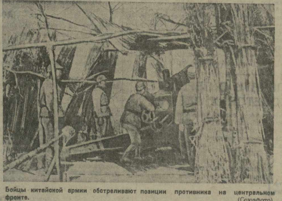
Бойцы китайской армии обстреливают позиции противника на центральном фронте. (Сюэфот).

Длинная партизанская армия в провинции Хэбэй, в районе Фупина (западнее Баодина), японская колонна в 4,800 человек 6 октября подверглась внезапному нападению китайских войск. В ожесточенной схватке больше 300 японцев убито и 80 человек захвачено в плен. Японские войска отступают обратно к железной дороге. Упорные бои происходят у подножья гор вблизи Шахэ. На Бадиань — Ханьской железной дороге партизаны захватили крупные пункты Чжотжоу (южнее Байпина) и Динсян (севернее Баодина). На днях партизаны напали на японские отряды в Цзиньхае и Дунгуане (на Тяньцзинь-Пукоуской железной дороге).