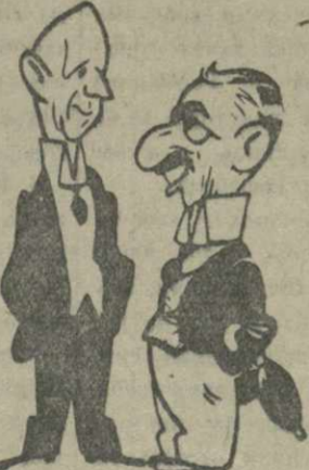
— Вам дорого стоила эта поездка в Берхтсгаде? — ЧЕМБЕРЛЕН: О нет, я расплатился... чеками. (Ретар).

Тяжелое дипломатическое поражение, нанесенное Францией в Мюнхене, в значительной мере является результатом все большего и большего за последние годы подчинения французской внешней политики директивам Лондона. Чем объясняется эта политика, гибельная для национальных интересов Франции, какие факторы определяют англо-французские отношения?