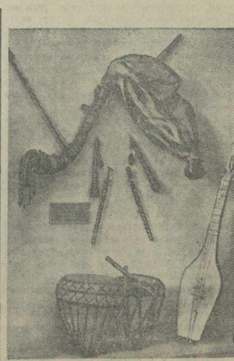
Выставка «Грузинские народные зрелища». На снимке: народные музыкальные инструменты.

На велодроме имени Л. Берия сегодня состоится велогонка, в которых участвуют лучшие велосипедисты Тбилиси — участники первого всегрузинского велотура. В велогонках принимают также участие орденосеи М. Рыбалченко.