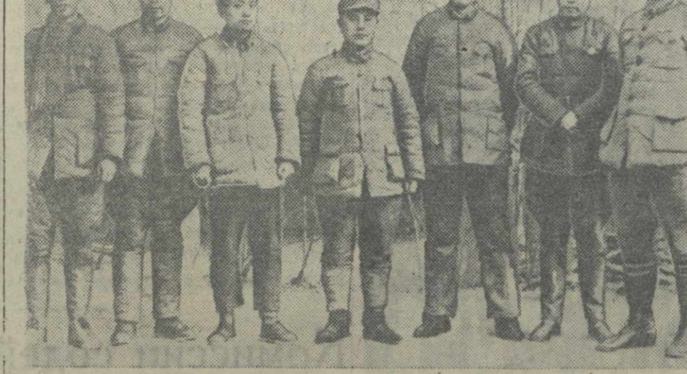
Группа членов Центрального Комитета Коммунистической партии Китая, среди которых тов. Мао Цзе-дун (третий справа) и тов. Ван Мин (четвертый справа).

В конце дня республиканские эскадрильи настигли соединение итальянских самолетов «Фиат» и атаковали его. Несколько «Фиатов» было сбито, однако