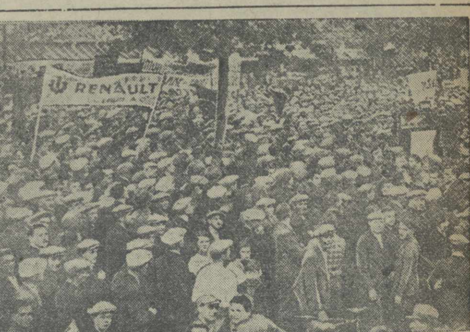
Митинг солидарности с чехословацким народом в Париже. (Союзфото).

МОСКВА, 17. (ТАСС). 15 октября в 5 часов вечера раскрылись двери библиотеки-музея В. В. Маяковского, находящейся в доме, где последние годы своей жизни провел поэт. Посетители с интересом рассматривают работы замечательного поэта-агитатора — острые, яркие отклики и зарисовки «Огонь Ростом».