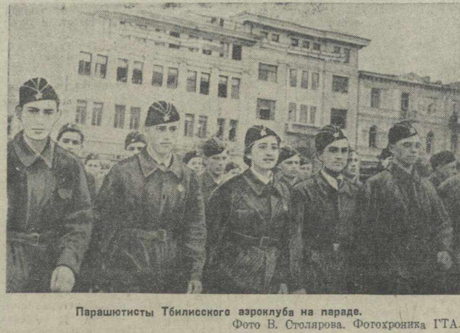
Парашютисты Тбилисского аэроклуба на параде.

Великий советский народ радостно празднует 1 мая. Раньше других этот замечательный день встретили пограничники на Дальнем Востоке. Во Владивостоке праздник уже был в разгаре, когда над столицей только занимался рассвет. Взошло солнце, и в его лучах засияла Москва. Древний город выглядит помолодевшим, в первомайском наряде. Свежий весенний день наполняет бодростью людей, которые вышли с утра на улицы, чтобы принять участие в народном празднике. Куда ни обращаешь взор, — всюду народ. Веселый, радостный, оживленный. Взрослые и молодежь, старики и дети. Вся Москва сегодня на улицах и площадях.