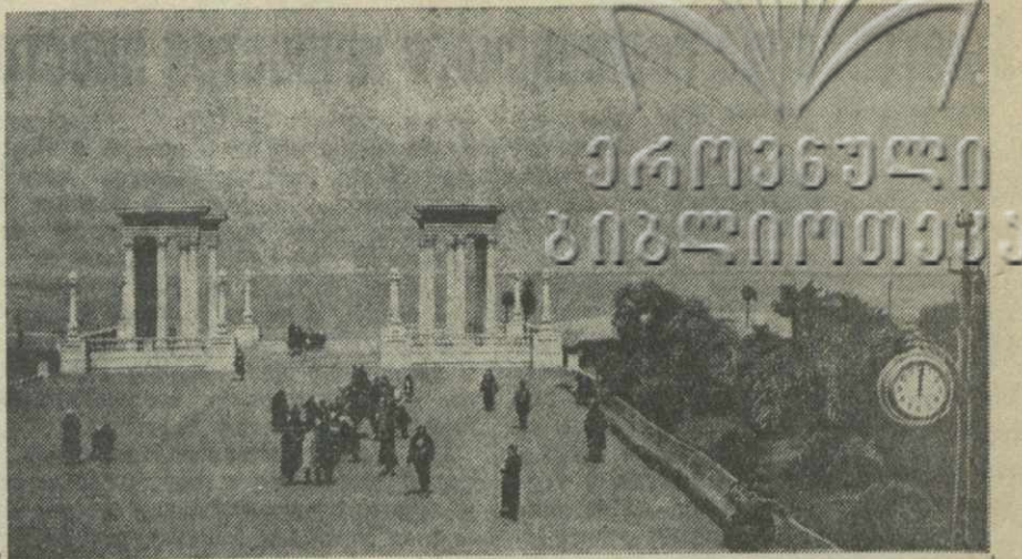
Батуми. Колоннада на Приморском бульваре у входа на пляж.