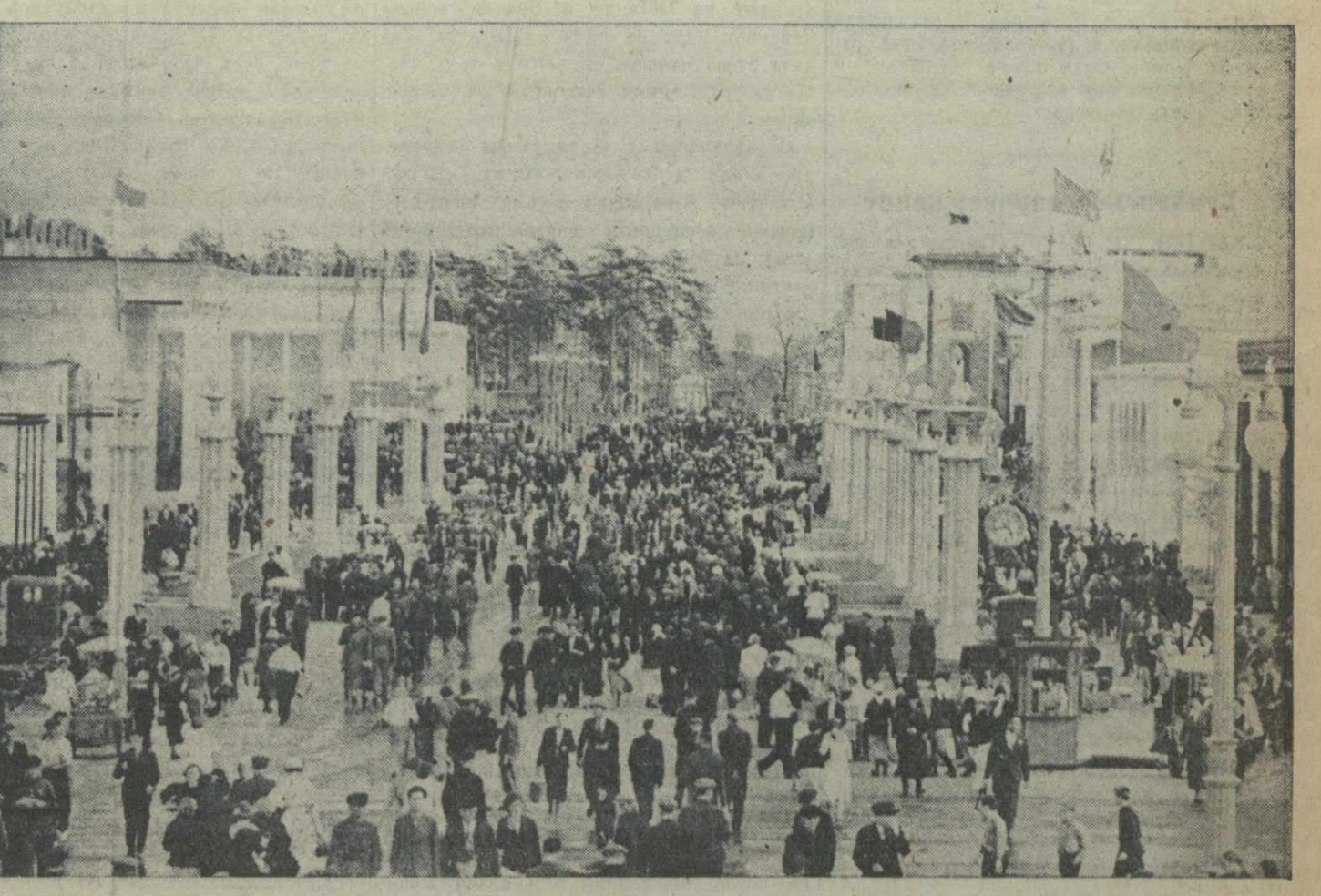
Всесоюзная сельскохозяйственная выставка 1940 года. На снимке: в аллее Дружбы народов.

ЛОНДОН, 26 (ТАСС). Агентство Рейтер передает сообщение, в котором говорится, что секретариат французского премьер-министра опубликовал следующее заявление: «В связи с ходом военных операций, который уже привел к назначению Вейгана главнокомандующим всеми театрами военных действий, прои-