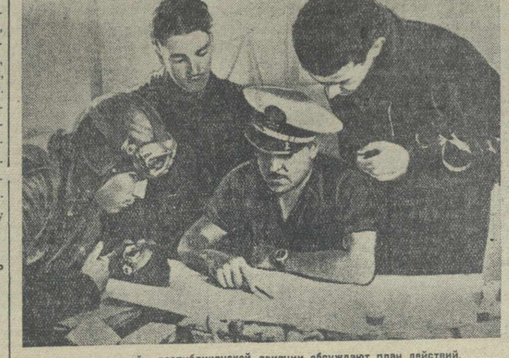
Летчики испанской республиканской авиации обсуждают план действий.

как продолжение переговоров, которые состоялись несколько дней назад между Гитлером и бывшим венгерским премьер-министром Дараньи, а также между Муссолини и начальником кабинета венгерского министерства иностранных дел Чаки.