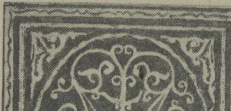
Рисунок переплета русского издания стихотворений Николаоза Бараташвили. (Гослитиздат, Москва, 1938 г.).