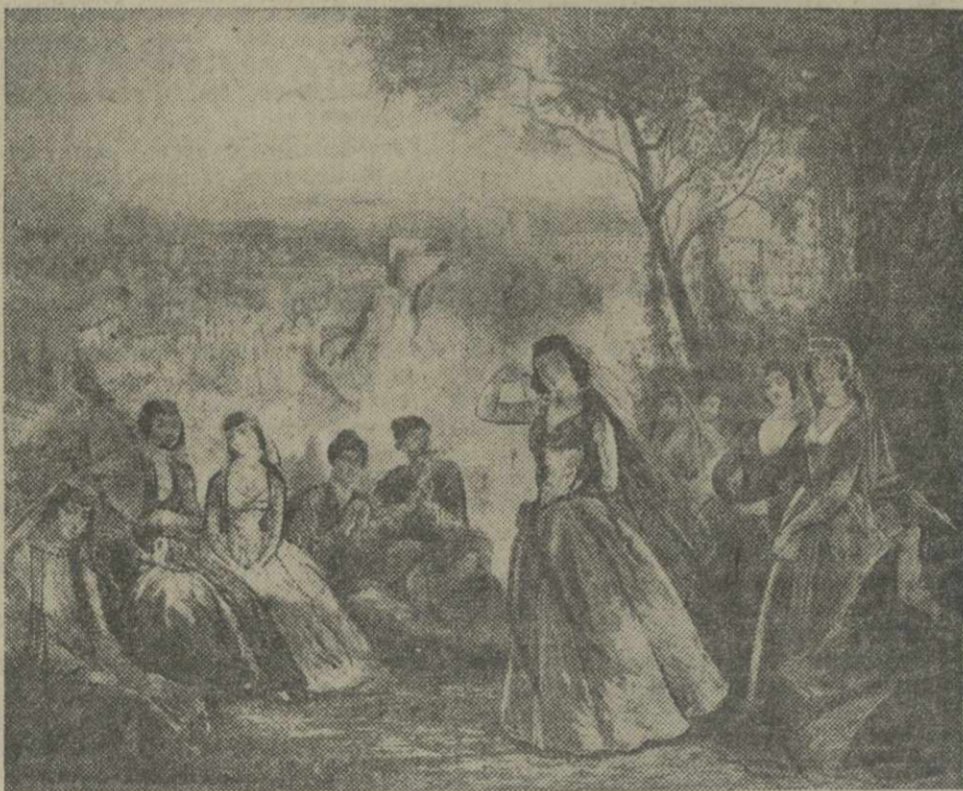
Старый Тбилиси. Рис. худ. Гагарина.

Даже самые печальные стихи Бараташвили заканчивают оптимистически. Так, в стихотворении «Сумерки на Мтышидзе», написанном в час горестных размышлений: