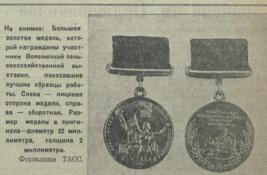
На снимке: Большая золотая медаль, которой награждены участники Всесоюзной сельскохозяйственной выставки, показавшие лучшие образцы работы. Слева — лицевая сторона медали, справа — оборотная. Размер медали в оригинале — диаметр 32 миллиметра, толщина 2 миллиметра.

Сегодня в 7 часов вечера состоится второе заседание конференции.