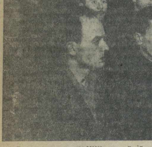
В зале заседаний XXII партийной конференции района имени 26 комиссаров.