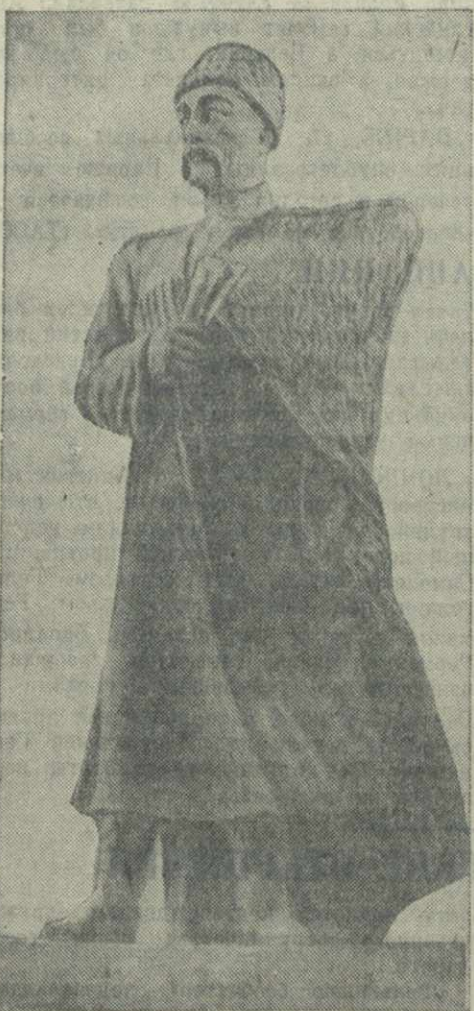
Коста Хетагуров. Скульптура т. Дзатиева для памятника великому осетинскому поэту, устанавливаемому в Сталинире.

На благоустройство Сталинира — центра Юго-Осетинской Автономной области — израсходовано во второй пятилетке около шести миллионов рублей. Число жителей в Сталинире с 4.000 человек в 1926 г. возросло сейчас до 14.000 человек.