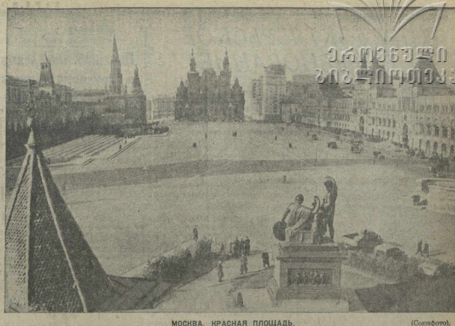
МОСКВА, КРАСНАЯ ПЛОЩАДЬ.