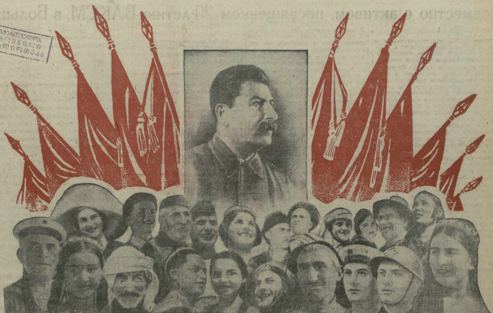
Да здравствует сталинская дружба народов СССР!

Братский привет делегатам трудящихся социалистической Украины — могучего фронта социализма на западных рубежах великой Страны Советов.