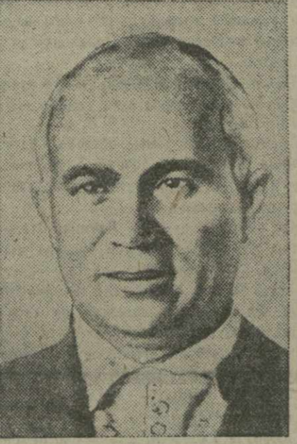
Тов. Н. С. ХРУЩЕВ.

ჩვენადაც ჩვენსთვის ღირსიზს იტყვიანაზი ვეც ჩვენსადაც ჩვენსთვის ჩვენსთვის!