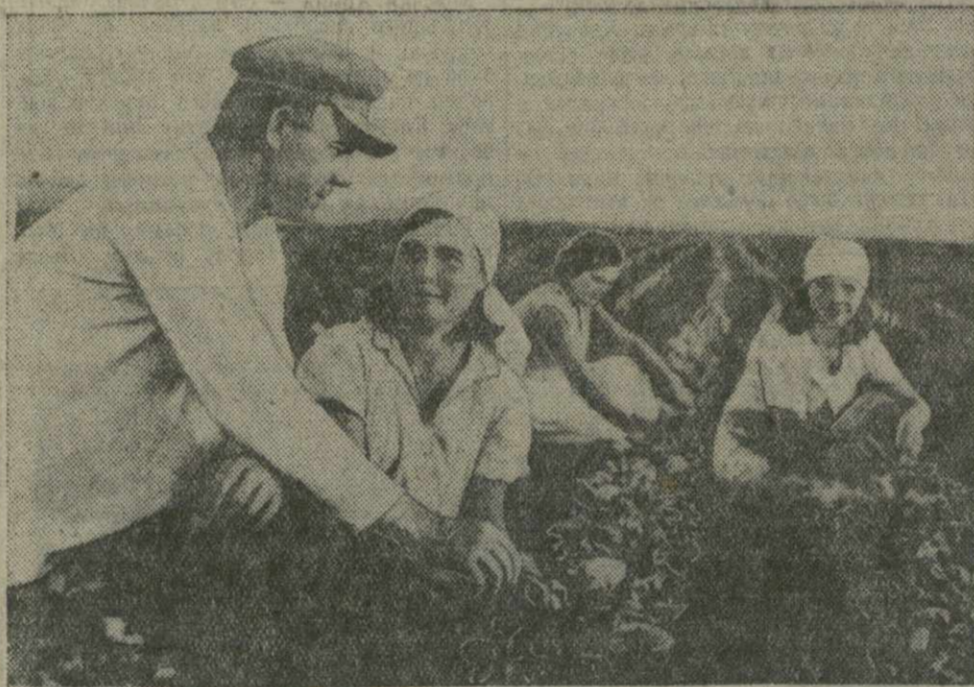
На хлопковых плантациях колхоза имени Сталина Генчицкого района Днепропетровской области.