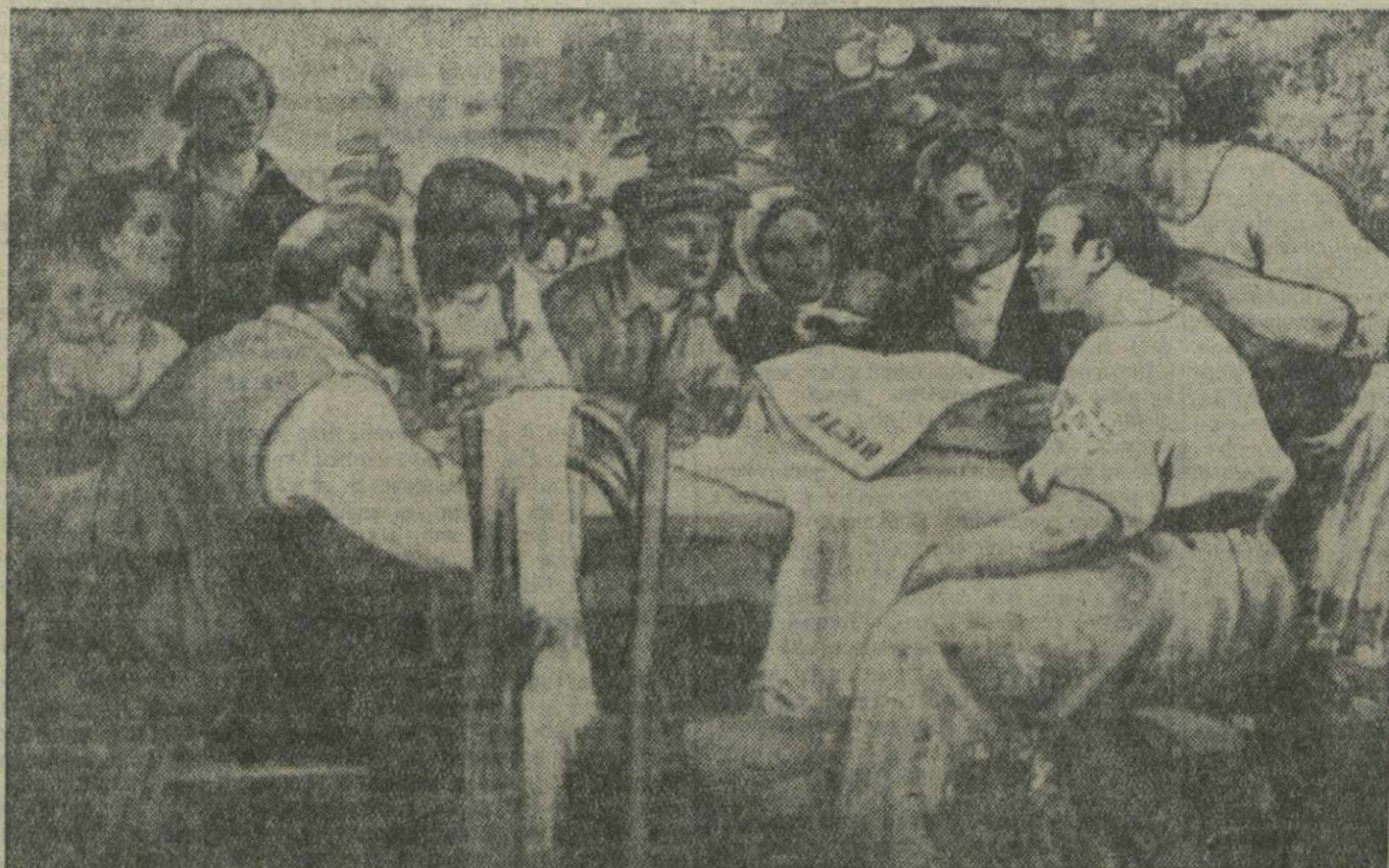
С выставки «Цветущая Социалистическая Украина».

«... Дружба между народами СССР — большое и серьезное завоевание. Ибо пока эта дружба существует, народы нашей страны будут свободны и непобедимы. Никто не страшен нам, ни внутренние, ни внешние враги, пока эта дружба живет и здравствует». И. СТАЛИН.