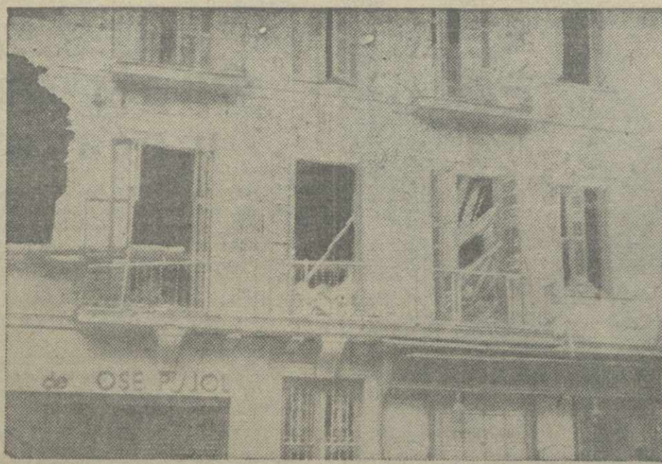
Дом в Барселоне после бомбардировки фашистской авиацией.

В ЮЖНОМ КИТАЕ На всех фронтах вокруг Кантона продолжаются бои. 14 ноября китайские партизаны ворвались в Кантон и подожгли несколько складов с конфискованными японцами товарами и продовольствием.