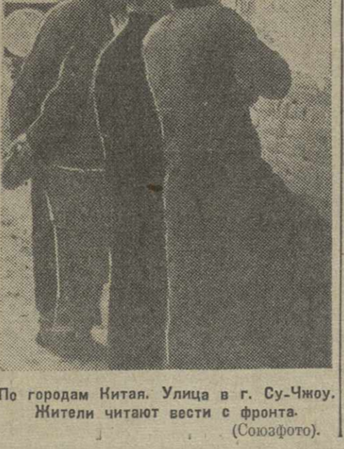
По городам Китая. Улица в г. Су-Чжоу. Жители читают вест с фронта.

В заключение генерал Сыровы сообщил, что на следующей неделе будет созвано национальное собрание для выборов нового президента.