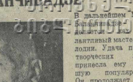
В дальнейшем М. А. Баланчивадзе открыл для себя талантливый мастер мелодии. Удача первых творческих шагов принесла ему большую популярность.

Исполнился год со дня смерти одного из основоположников грузинского оперного искусства народного артиста Грузинской ССР композитора Мелитона Антоновича Баланчивадзе.