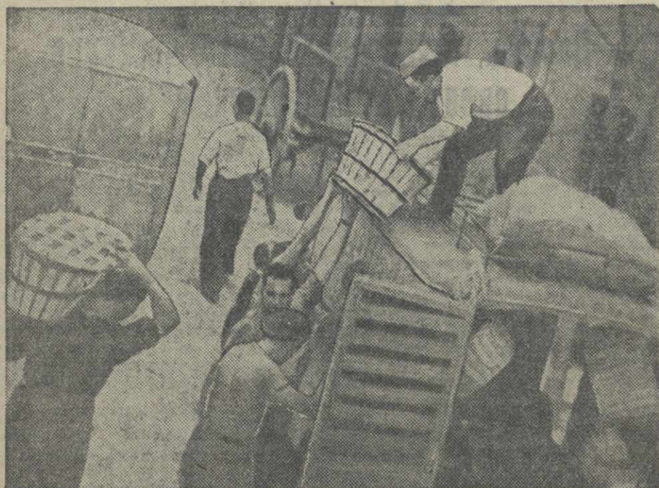
В Мадрид прибыли грузинки с продовольствием, присланным организациями трудящихся разных стран.