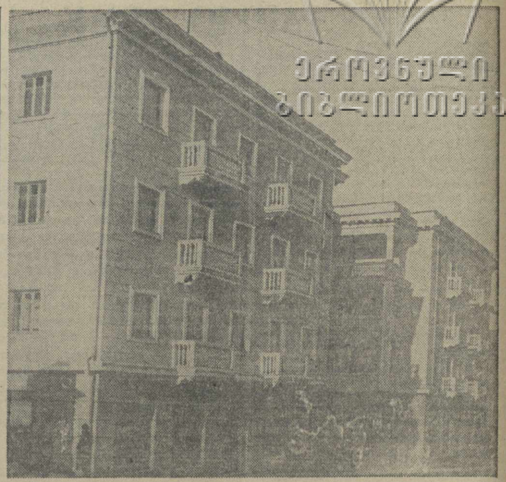
Новый жилой дом на Инженерной улице в Тбилиси.

ПАРИЖ, 1. (ТАСС). «Юманите» публикует обращение французской коммунистической партии в связи с итогами всеобщей забастовки протеста против чрезвычайных декретов. Отмечая высокий процент участия в забастовке рабочих всех отраслей промышленности и подчеркивая, что забастовка происходила в условиях чрезвычайных мероприятий правительства, французская партия заявляет, что забастовка явилась «ответом трудящихся Франции на политику «социальной реакции» и выражением подлинных чувств всего французского народа».