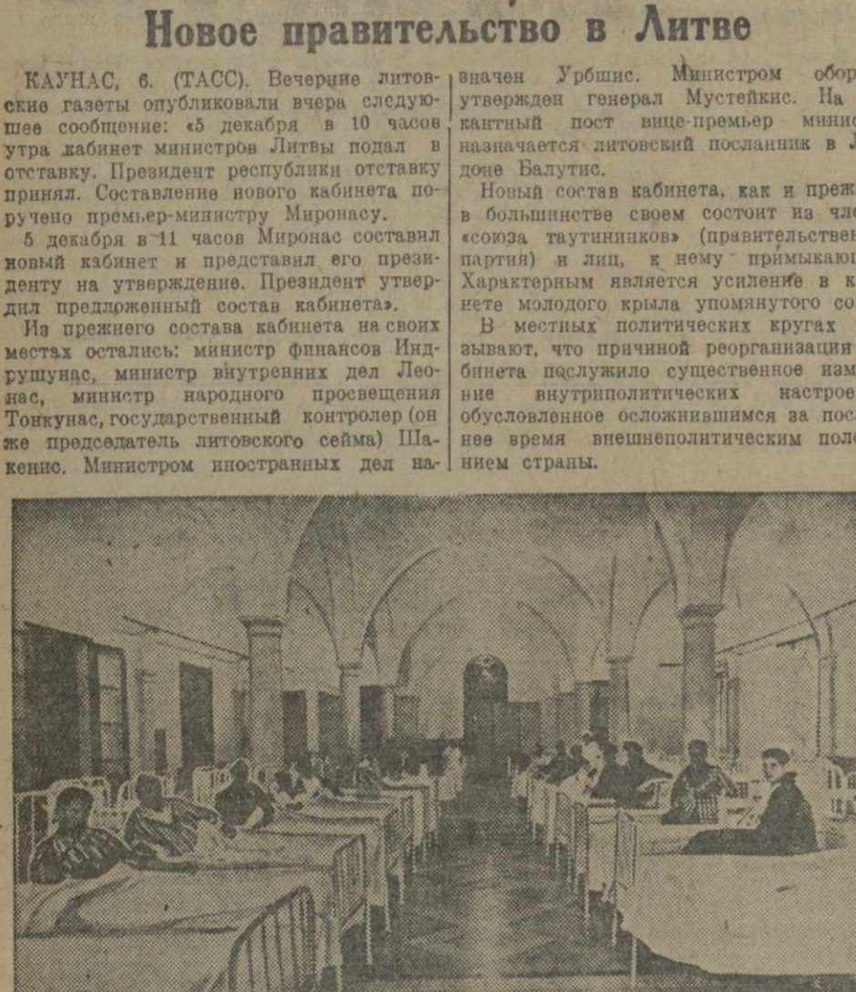
Раненые бойцы республиканской армии в новом госпитале, созданном в окрестностях Валенсии на средства, собранные в порядке международной солидарности трудящихся.

В местных политических кругах указывают, что причиной реорганизации кабинета послужило существенное изменение внутриполитических настроений, обусловленное осложнившимся за последнее время внешнеполитическим положением страны.