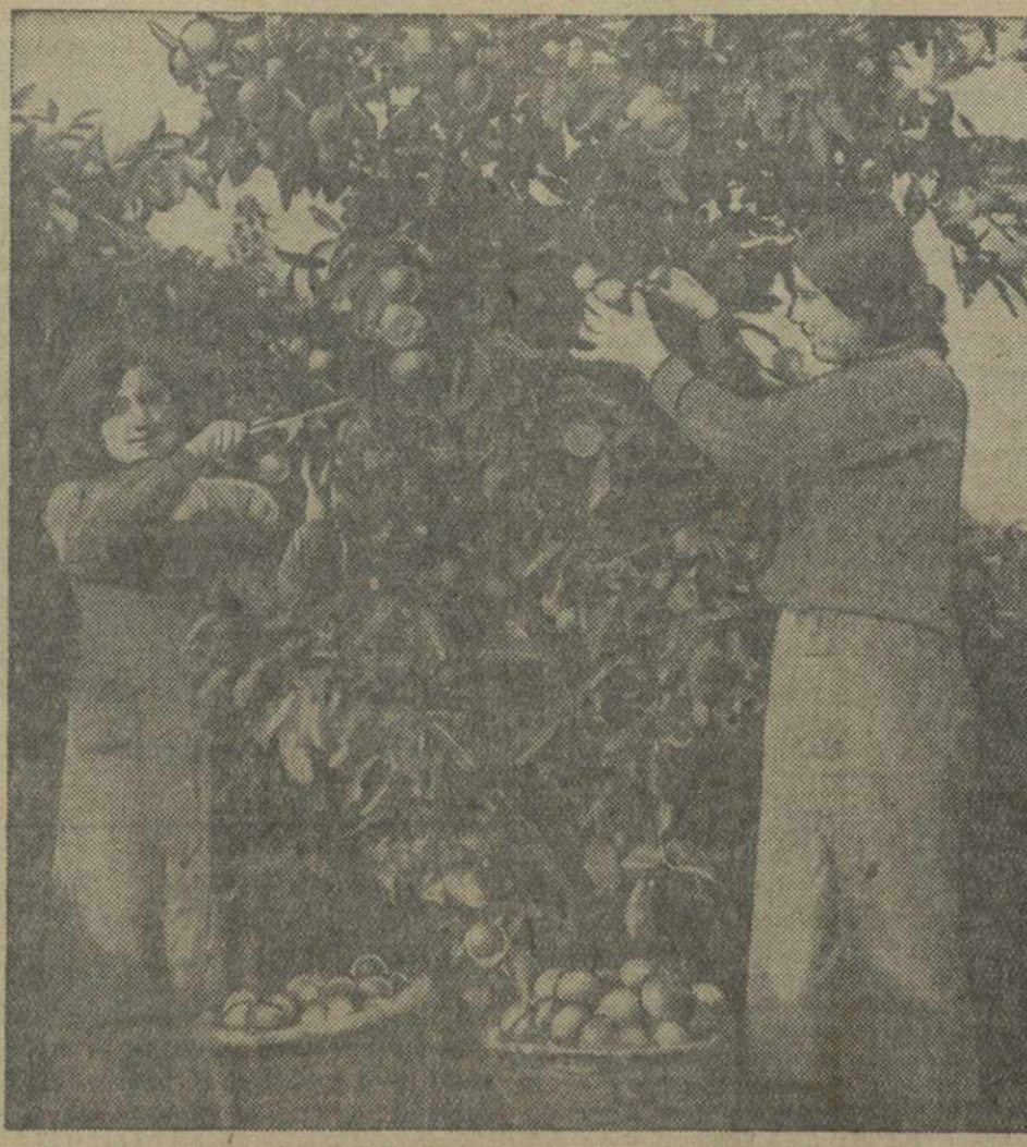
Сбор мандаринов в субтропическом совхозе № 1 Наркомзема Аджарии.

На этом же заседании Совет Народных Комиссаров Грузинской ССР рассмотрел ряд других вопросов, по которым приняты соответствующие решения.