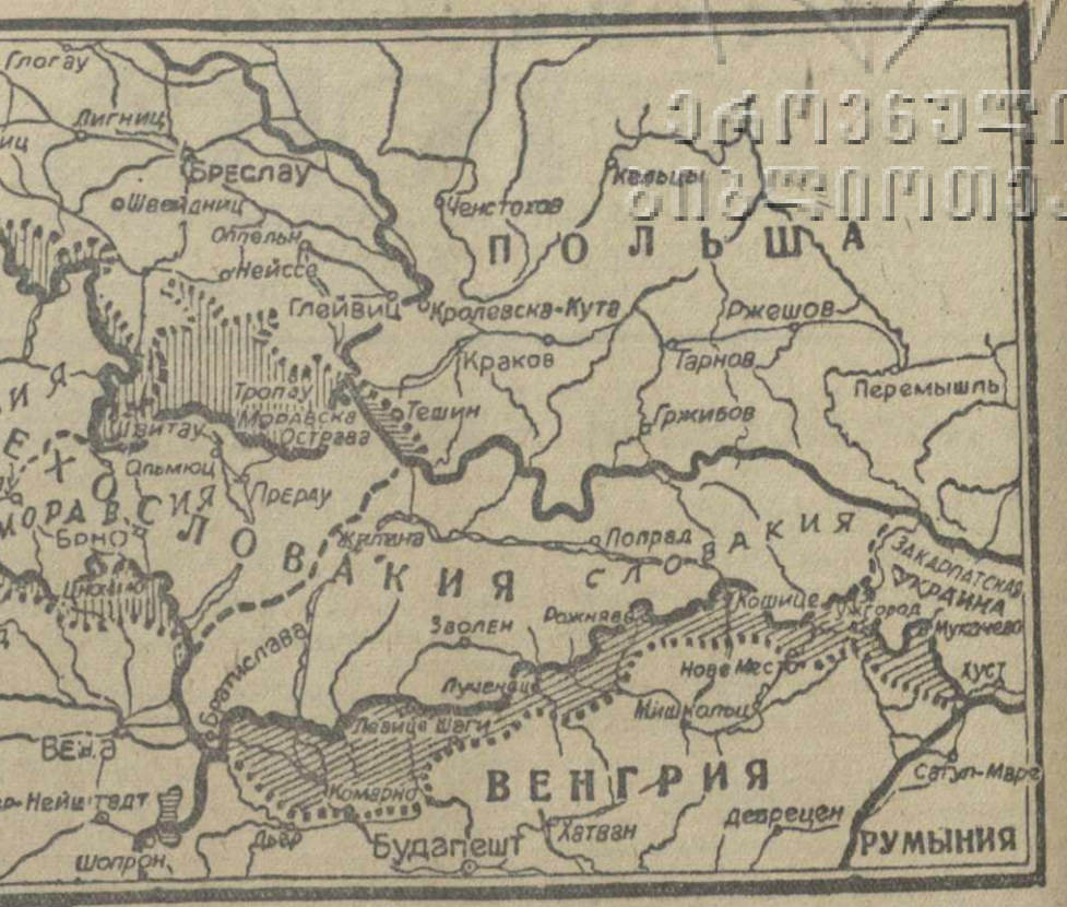
Карта Чехословакии после раздела.