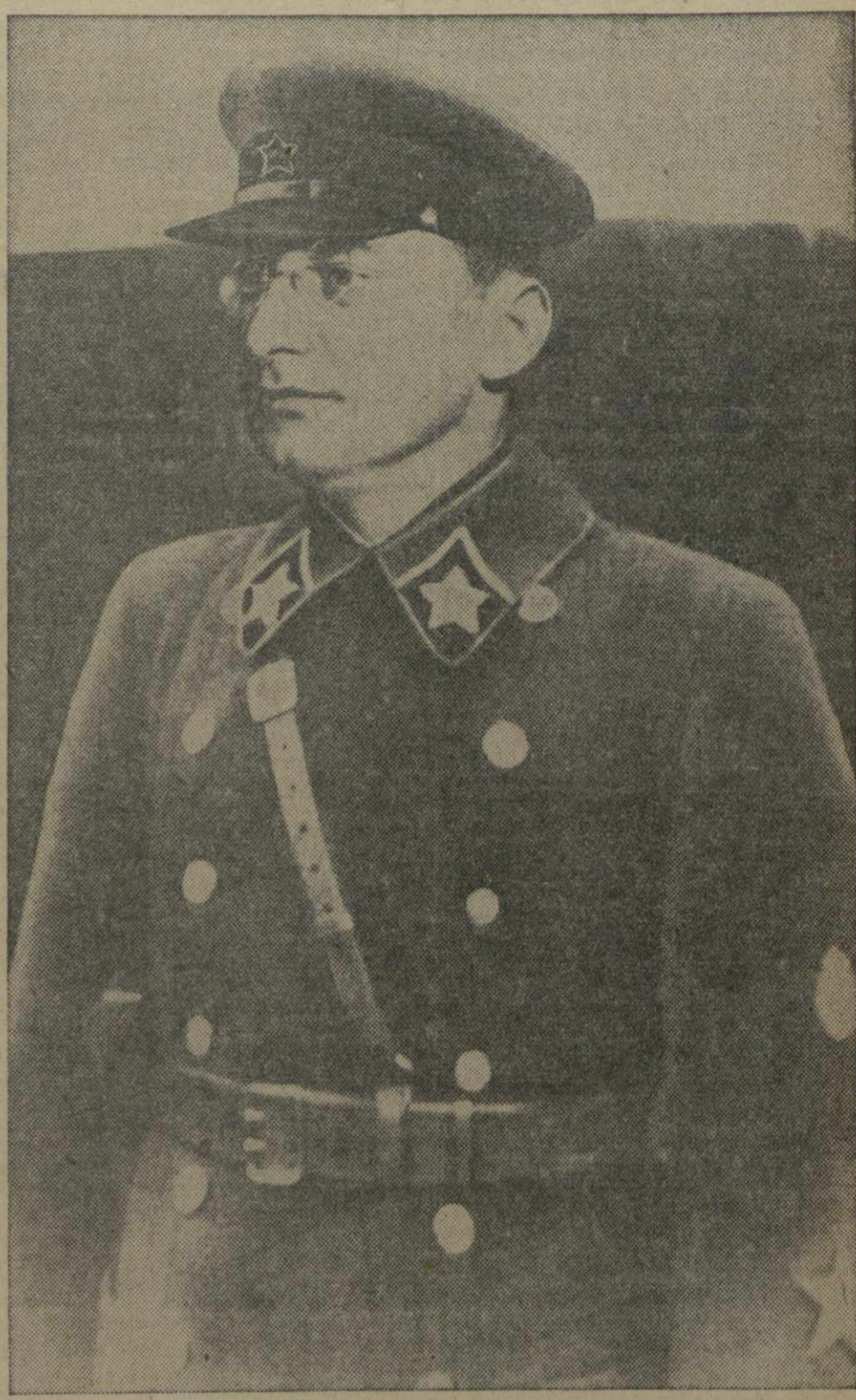
Народный Комиссар Внутренних Дел СССР товарищ Лаврентий Павлович БЕРИЯ.

Успешным исполнением планов встретили день Конституции передовые советские и колхозы Абхазии.