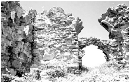
„არს მთის კალთას, სკანდას, სასახლე მეფეთა და ციხე დიდი, დიდშენი“ ვახუშტი ბაგრატიონი