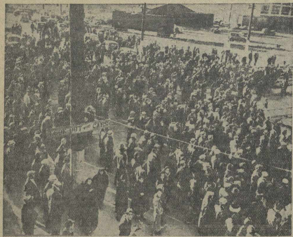
Рабочие одного из крупнейших мясоконсервных заводов в США объявили забастовку протеста против понижения заработной платы. На снимке: бастующие рабочие у входа на завод.