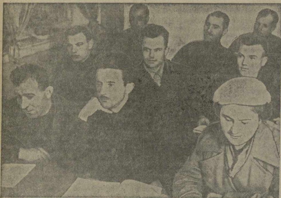
Коммунисты и комсомольцы Тбилисского мельничного комбината слушают лекцию о произведении В. И. ЛЕНИНА «Что такое «друзья народа» и как они воюют против социал-демократов?».