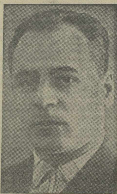
Первый заместитель Народного Комиссара Внутренних Дел СССР тов. В. Н. МЕРКУЛОВ.