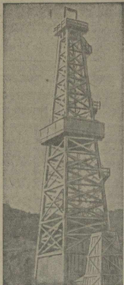
Нефтяная скважина № 15 на промысле Грузнефти в Морио.

Начальник конторы связи, бухгалтер, счетовод колхоза, ведущий психоджварской семилеткой, детским домом — все они из колхоза Цихи-Джвари.