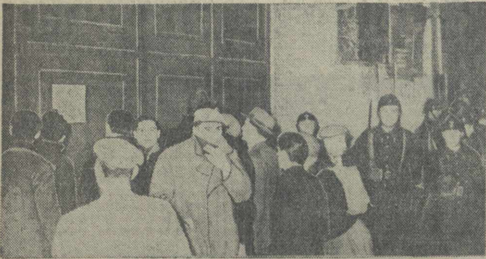
Французские предприниматели продолжают увольнять десятки тысяч рабочих — участников забастовки. На снимке: у ворот завода Фарман, на котором приступило к работе только 705 человек из 3 тысяч. Рабочие читают сообщение об увольнении.