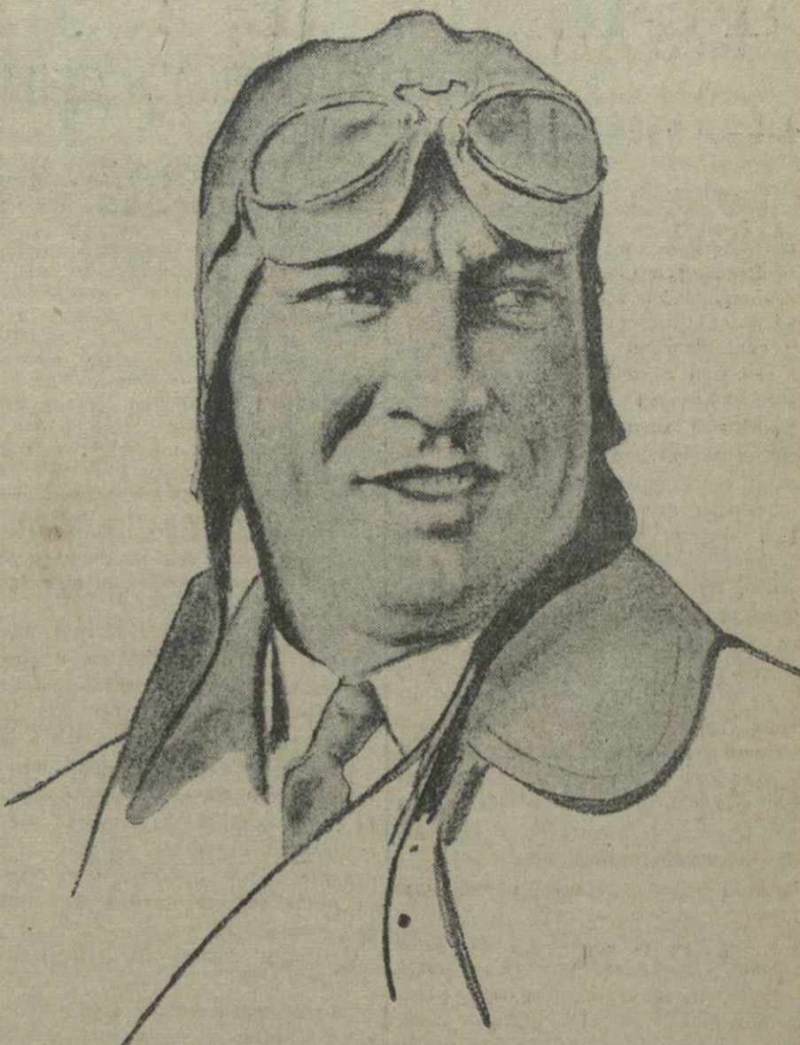
ВАЛЕРИЯ ПАВЛОВИЧ ЧКАЛОВ