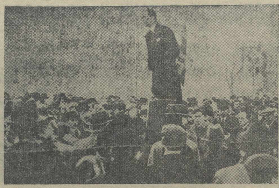
Митинг протеста в Лондоне против зверских расправ с еврейским населением в фашистской Германии.

16 декабря 50 человек, в том числе настоящие и бывшие министры, их заместители и депутаты обратились к правительству с письменной просьбой разрешить деятельность партии «Фронт национального возрождения».