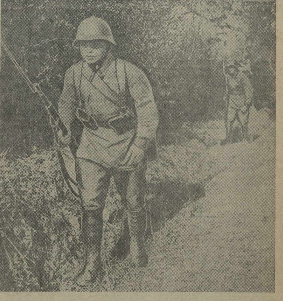
Молодые бойцы 9-ской части Закавказского военного округа на тактических занятиях.