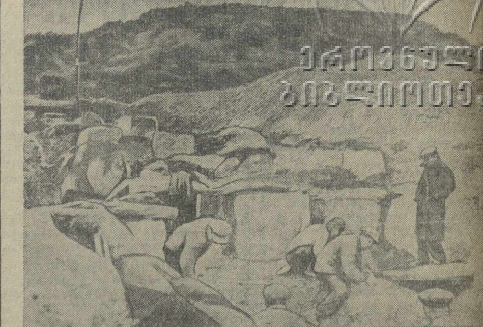
Археологические раскопки в районе Мцхета. (Фото В. Поднякова).

В последние дни батальону удалось установить радиосвязь со штабом китайских войск.