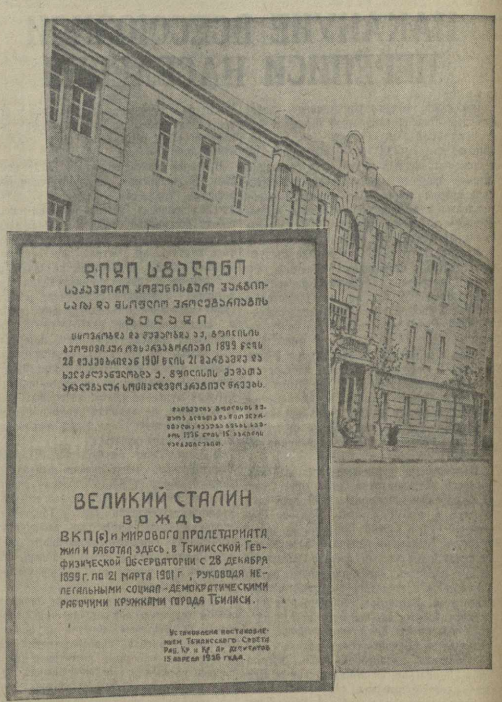
Мемориальная доска на здании Тбилисской геофизической обсерватории, где в 1899—1901 гг. жил и работал великий СТАЛИН.