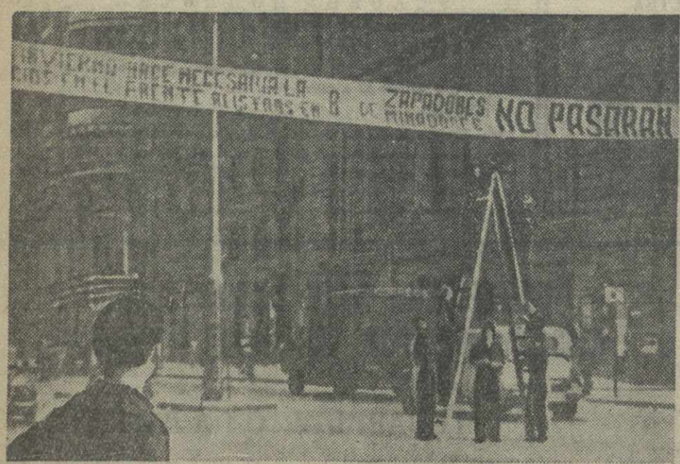
Молодежь Мадрида развешивает плакаты о лозунгах, призывающих добровольцев вступить в инженерные части испанской республиканской армии.