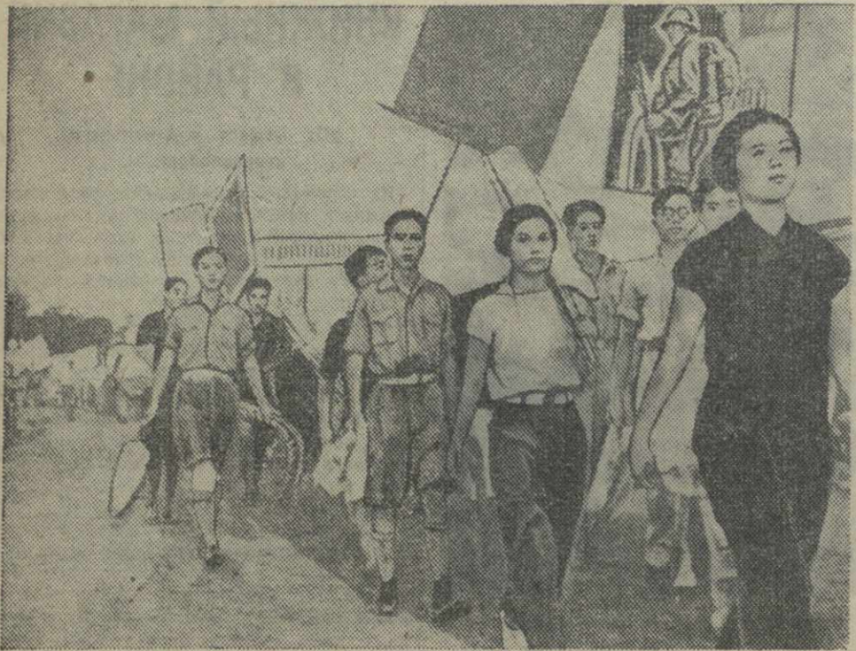
Китайская молодежь с энтузиазмом участвует в борьбе с японскими захватчиками. На снимке: патриотическая демонстрация молодежи в одном из китайских городов.