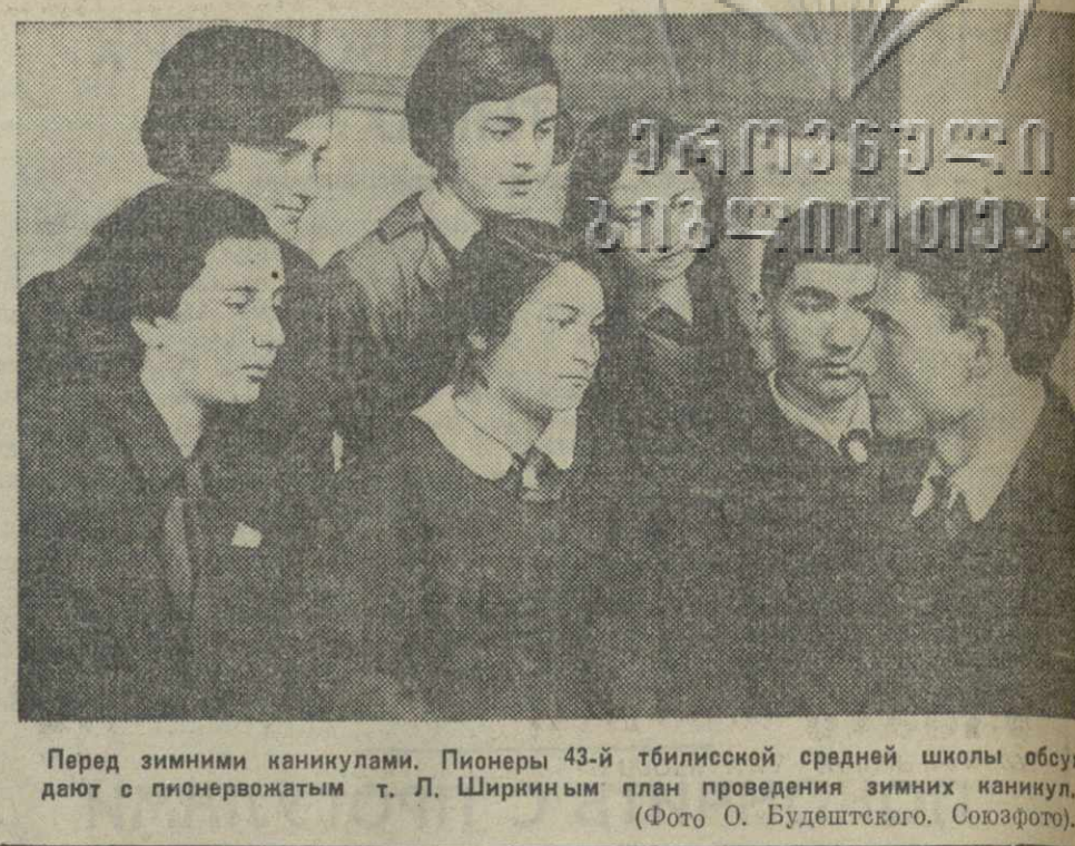
Перед зимними каникулами. Пионеры 43-й тбилисской средней школы общаются с пионервожатым т. Л. Шириним план проведения зимних каникул.