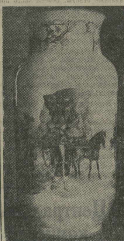
И 20-летию Великой Октябрьской Социалистической революции Ленинградский фарфоровый завод имени Ломоносова готовит серию ваз с рисунками на темы: жизнь народов СССР и Сталинская Конституция. На снимке: ваза с рисунком «Красный обиход». Работа художницы Л. И. Благодатной.

В колхозе «Цинсела», Хашурского района, выдана и вывезена не установленная и ничем не оправданная «система» учета труда на уборке кукурузы. На каждую корзину убранный кукурузы здесь выписывают на клочке бумаги чек, по которым к вечеру бригадир начисляет трудовые. При такой «си-