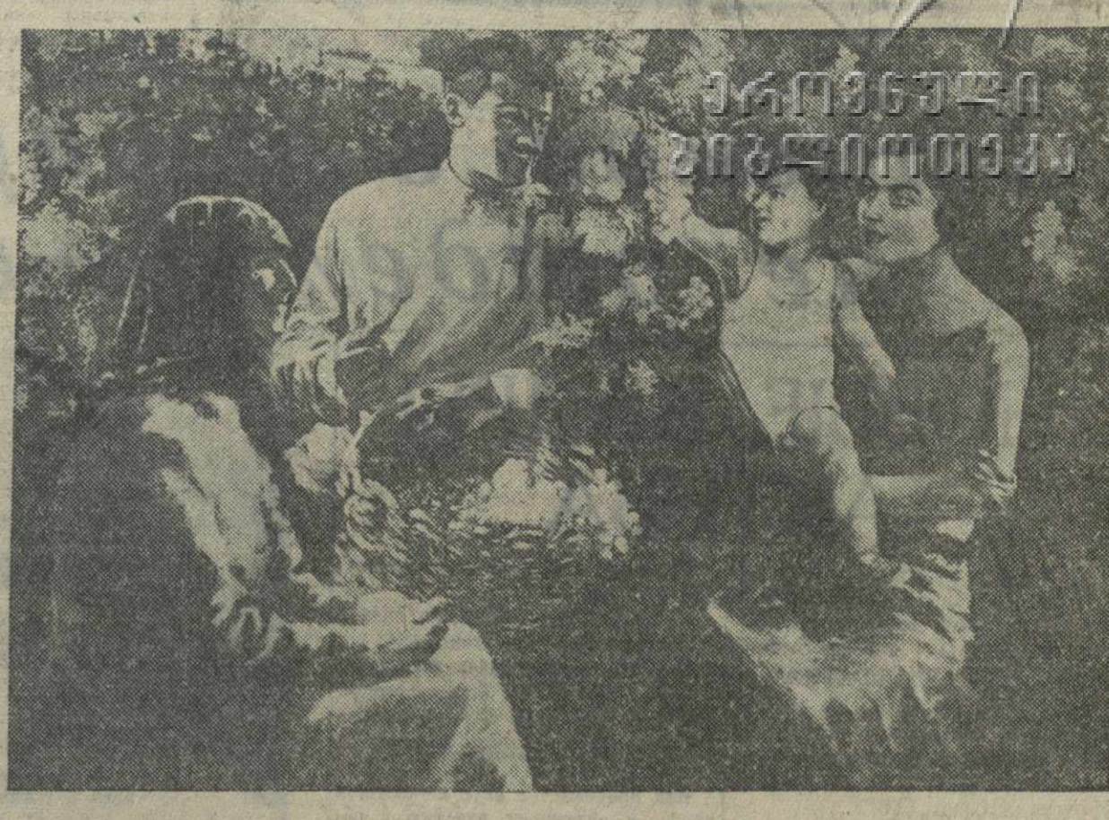
«Счастливая семья» — картина худ. А. Гиголашвили.

Еще нет полных данных о приводе сельскохозяйственных продуктов на Тбилисскую межрайонную колхозную ярмарку, но уже отдельные, далеко еще не полные сведения, говорят о колхозном изобилии, о громадном урожае этого года. Возьмем для примера Крытый рынок Сталинского района. В обычные дни сюда завозилось в среднем до 700 кило помидоров, которые продавались по 2 рубля за кило. Сейчас ежедневный привоз помидоров вырос до 3.800 кило, а цена на них снизилась до 1 рубля. Поступление картофеля с 290 выросло до 3.300 кило, цена на него упала с 1 рубля до 60 коп. за кило. Лук, продававшийся по 3.800 кило, а цена на него снизилась до 1 рубля. Поступление капусты с 290 выросло до 3.300 кило, а цена на нее упала с 1 рубля до 60 коп. за кило. Лук, продававшийся по 3.800 кило, а цена на него снизилась до 1 рубля. Поступление капусты с 290 выросло до 3.300 кило, а цена на нее упала с 1 рубля до 60 коп. за кило.