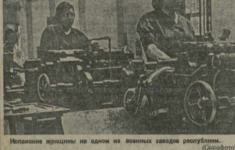
Испанские женщины на одном из военных заводов республики.

ПАРИЖ, 3 (ТАСС). Агентство „Эспаль“ сообщает, что в Малаге в ночь с 28 на 29 октября высадилось около 6 тыс. итальянских солдат.