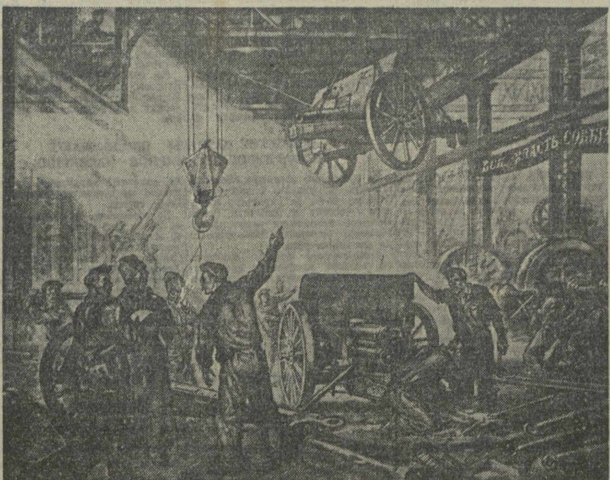
И двадцатилетие Великой Октябрьской Социалистической революции. На снимке: рисунок худ. Щеглова: «На Путиловском заводе в Октябрьские дни». (Из подготовленного к печати II тома «Истории гражданской войны в СССР».)