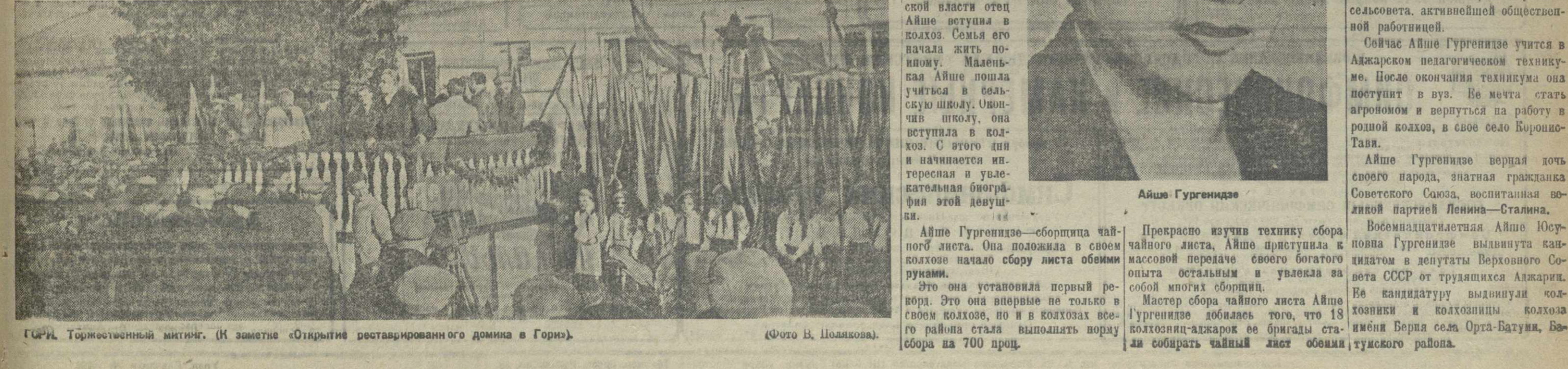
Гори. Торжественный митинг. (К записке «Открытие реставрированного домика в Гори».)