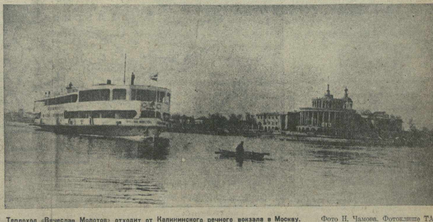
Теплоход «Вячеслав Молотов» отходит от Калининского речного вокзала в Москву.

БЕРЛИН, 1. (ТАСС). Германское информационное бюро передает следующий обзор военных действий за три недели германского наступления на западе: