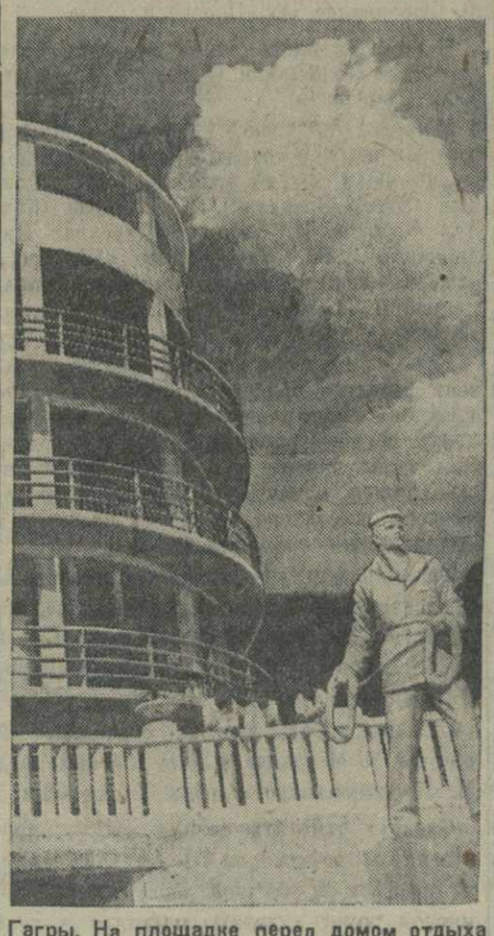
Гагра. На площадке перед домом отдыха имени Челюскинцев.