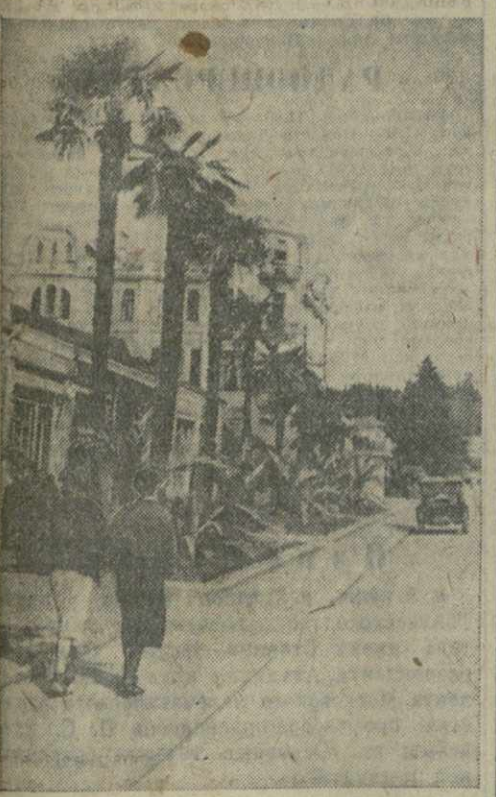
Сухуми. Улица Ленина.