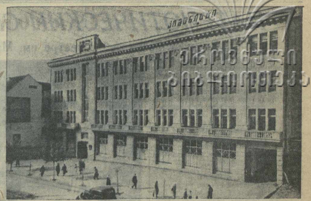
Тбилиси. Здание комбината «Коммунисти».