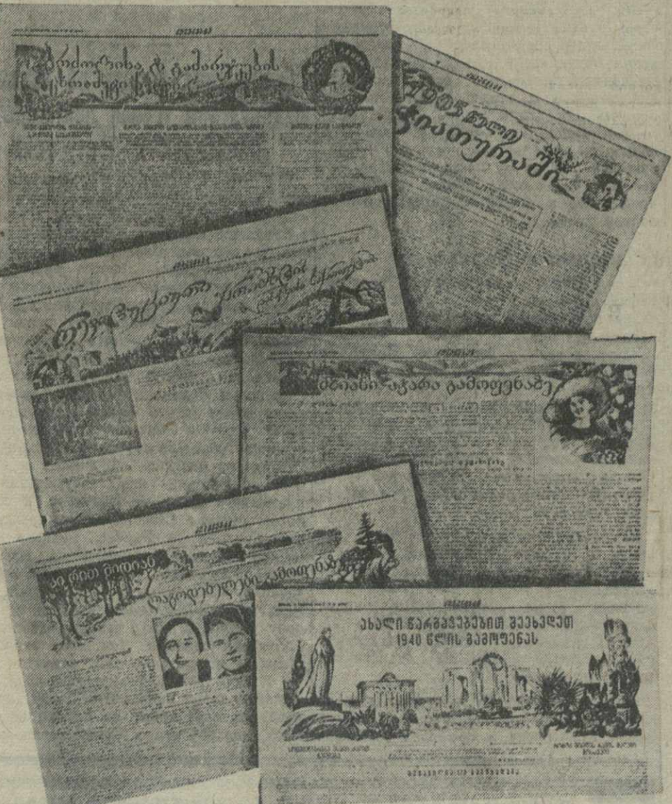
Оформление отдельных газетных полос «Комунисти», посвященных истории революционного движения и показу передовиков сельского хозяйства Грузии.

Над тобою солнце родины, Как бездонный водом, Героичное прошлое Мы твою сейчас поем. Ты всегда, газета, борешься Словом ясным и простым. Солцем СТАЛИНА согрета, Потом и грешь ты. Держишь знамя МАРКСА-ЛЕНИНА Высоко над головой, С ним вперед идешь без усталы, Агитатор боевой! Овещашь солнцем СТАЛИНА Наш нивы, высы гор, Меч — ты; против угнетателей Направлешь, острый взор. Много раз бывала сконванной, Но вставала, богатырь, Кто погасит солнце яном, Овещашь мир?! Зажжена руною СТАЛИНА, Силой ты равнишься о ком?! Ты о рабочих беседуешь На понятном языке. Ты для нас источник знания, Свет, струящийся с высоты, Справедливо называвшись «Комунисти» нашим ты. Вел тебя к победам БЕРИЯ В громе, в грохоте боев И ряды твои железные Он очистил от врагов. И сейчас полями веющими Ты идешь во всей красе, Гостя ты для всех желанная, Обвещашь сразу всех. Двадцать лет тебе, Ты радостна, Громкогласна, молода, За тебя родному СТАЛИНУ Благодарность передам! Перевод с грузинского.