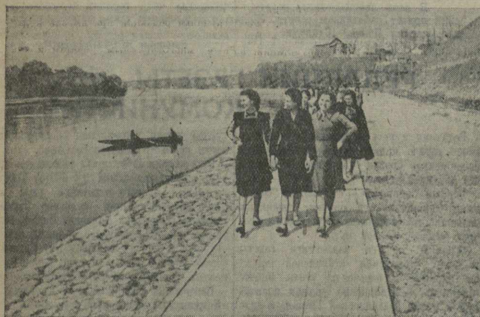
Учащиеся горной белорусской средней школы на набережной реки Неман в Гродно (БССР).