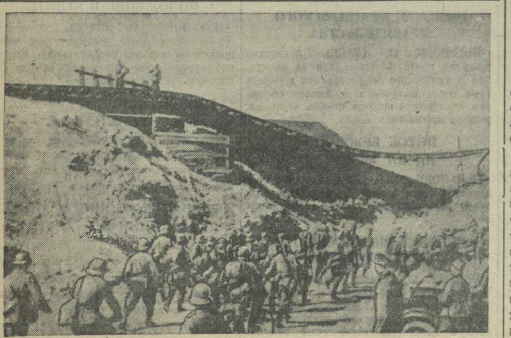
Германские войска в Бельгии.

Со вступлением Италии в войну средиземноморский бассейн становится одним из важнейших театров военных действий.