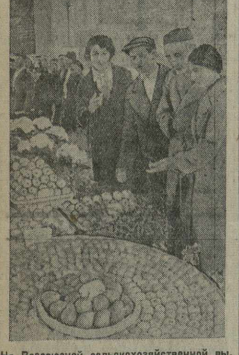
На Всесоюзной сельскохозяйственной выставке. Участники выставки от Горинского района в павильоне «Садоводство».

СТАЛИНИР. (По телеграфу). В колхозе села Вапшловани (Дзидгарский район) построен новый водопровод.