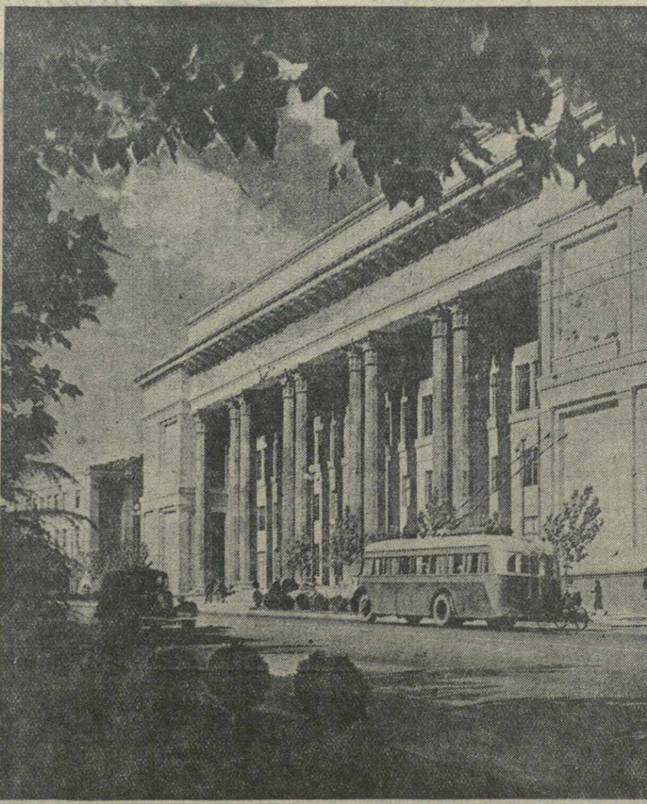
На проспекте Руставели. У здания Тбилисской филиала Института Маркса — Энгельса — Ленина.

Сады и парки города переполнены отдыхающими. Ключом бьет жизнь на стадионах и спортивных площадках, на озерах Лиси.