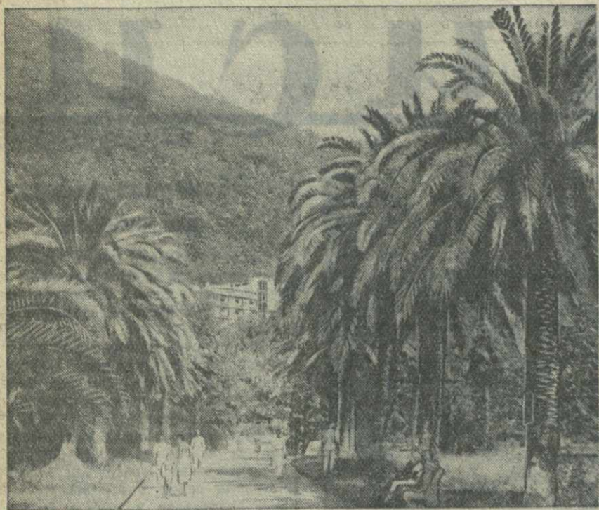
Гагры. В курортном парке.