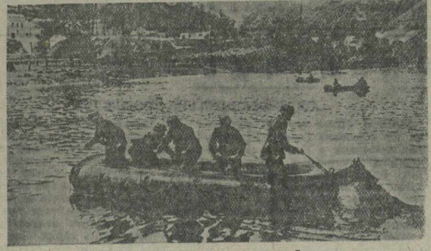
Переправа немецких солдат через реку в Бельгии.

ЛОНДОН, 14. (ТАСС). По сообщению агентства Рейтер, английское правительство обратилось к правительству Франции с посланием, в котором говорится, что Англия будет помогать Франции всеми силами. «Снова, — говорится в послании, —