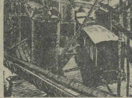
Трест «Ткибулуголь». На одном из производственных участков. Рис. студента Академии художеств Грузии А. Саркисова.

За два последних сезона театр поставил немало классических и современных пьес — грузинских и переводных, создав ряд художественно-полноценных спектаклей.