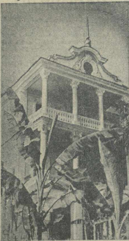
Дом отдыха Черноморского флота в Сухуми.