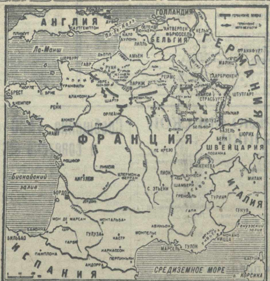
Наступление германских войск