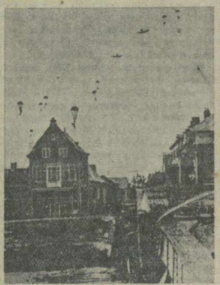
Снабжение немецких войск военными материалами, спускаемыми на парашютах.