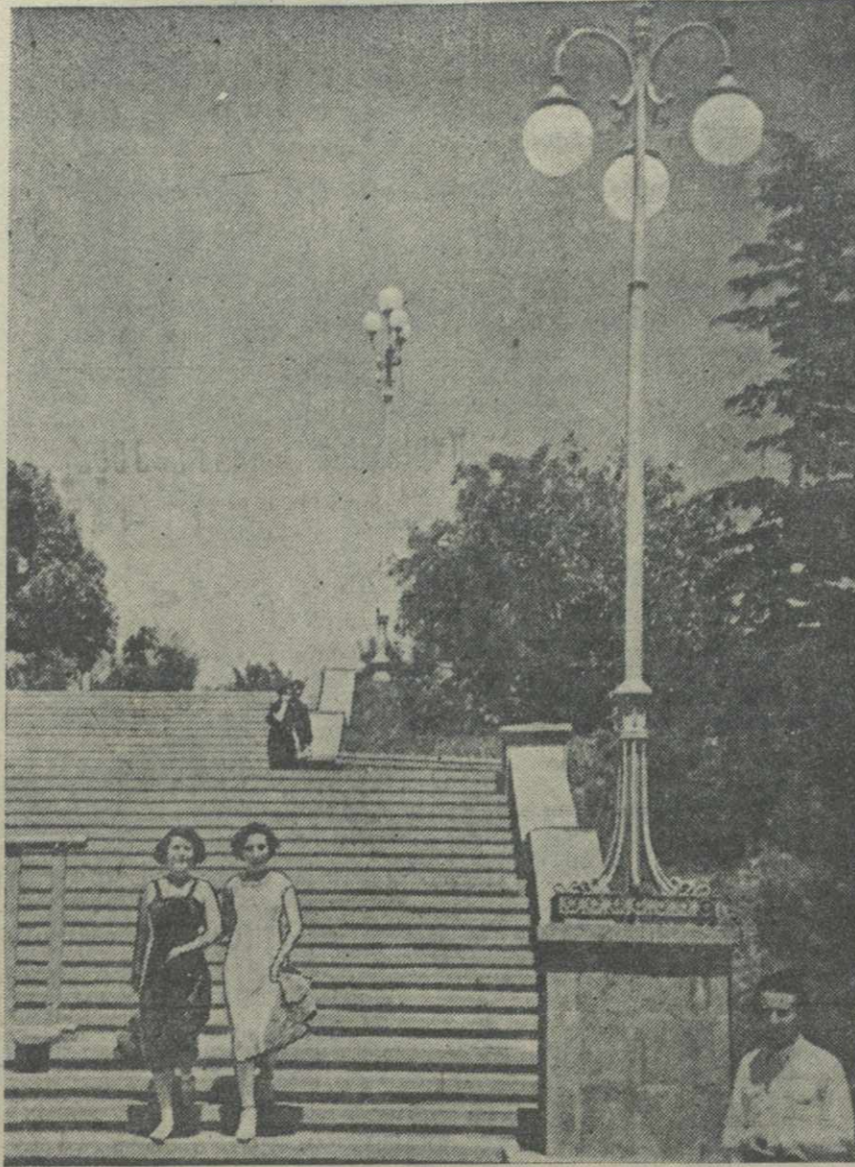
Лестница в парке культуры и отдыха имени СТАЛИНА (Тбилиси).

В этом году Грузкоопертрест приготовит 25 тонн соленой джонджоли.