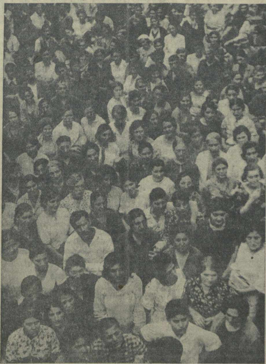
Митинг рабочих и служащих Тбилисской швейной фабрики № 1 имени С. Орджоникидзе, посвященный обсуждению Указа Президиума Верховного Совета СССР о переходе на восьмичасовой рабочий день, на семидневную рабочую неделю и о запрете на самовольный уход рабочих и служащих с предприятий и учреждений.

В резолюциях, принятых на митингах, тбилисские горняки единодушно одобрили Указ Президиума Верховного Совета СССР от 28 июня.