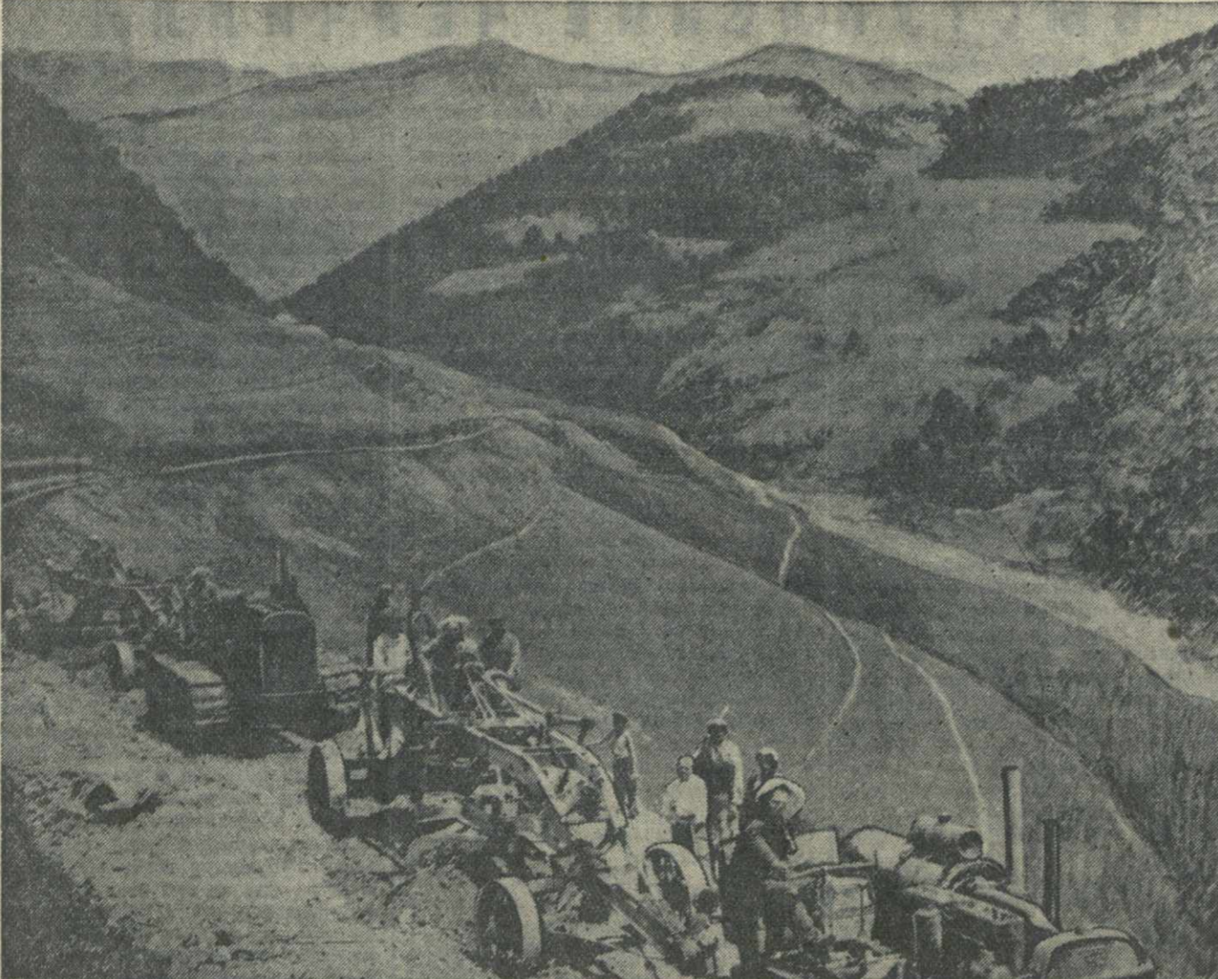
На склонах гор, где в прошлом году из-за крутиины, вездик, скользкой почвы, осторожно спускались или ползли, поддерживая свои лошади, сейчас уже работают по профилирующей дороге тракторы «Т-3» с трейлерами и другие вспомогательные механизмы.

В общей системе партийной работы цеховые партийные организации призваны сыграть большую роль.