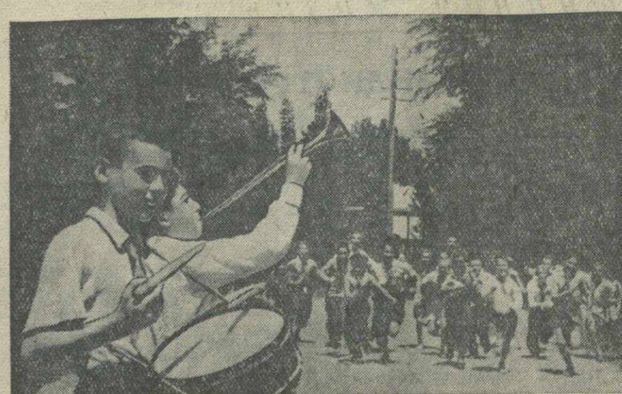
На детской площадке в парке культуры и отдыха имени С. Орджоникидзе.