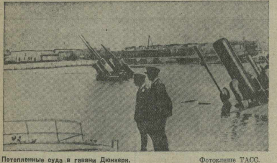
Потопленные суда в гавани Донгери.