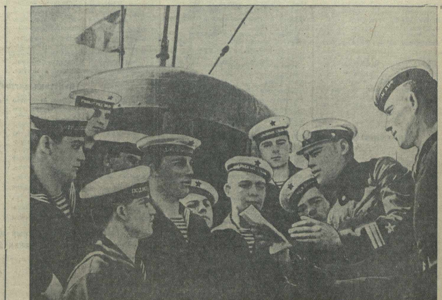
Вояком N-ской подводной лодки проводит политинформацию (Краснознаменный Балтийский флот).

ПОЛТАВА, 16. (ТАСС). В двадцати километрах от города Луны в течение двух лет ведутся геологические разведки нефти.