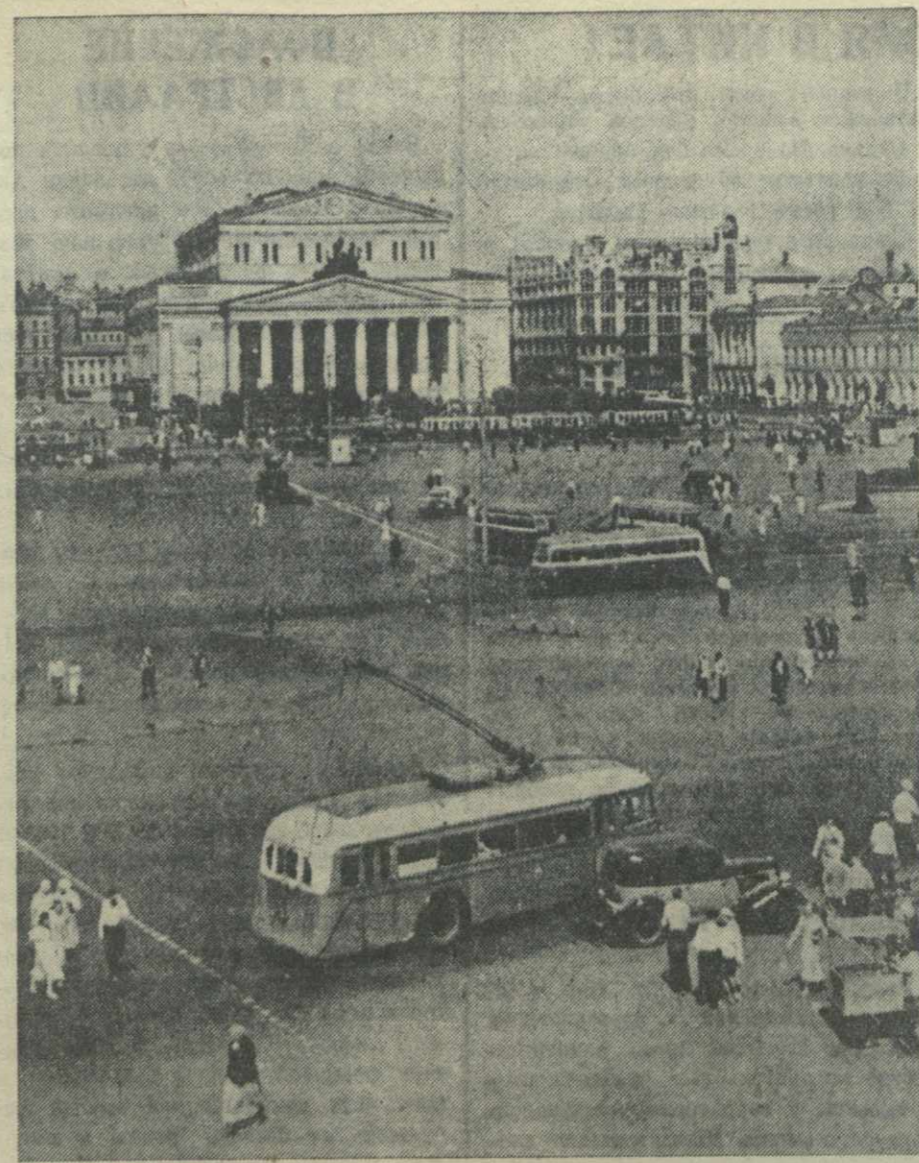
Москва. Площадь Свердлова.

Но враг просчитался. Танковые соединения Красной Армии за 8 часов прошли более 100 километров и застали противника врасплох: воспользовавшись открытыми проходами в противотанковых препятствиях, танки решительно атаковали противника значительно ранее того срока, чем он этого ожидал. В короткий срок и с малыми потерями для нас враг был