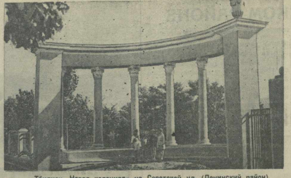
Тбилиси. Новая колоннада на Советской ул. (Ленинский район).

БЕРЛИН, 17. (ТАСС). Бюллетень «Динст аус Дейчланд» сообщает об освобождении бельгийских пленных. Первая группа в количестве 16 тысяч человек уже прибыла из Германии в Антверпен. В ближайшие дни ожидается освобождение еще 40 тысяч бельгийских пленных.