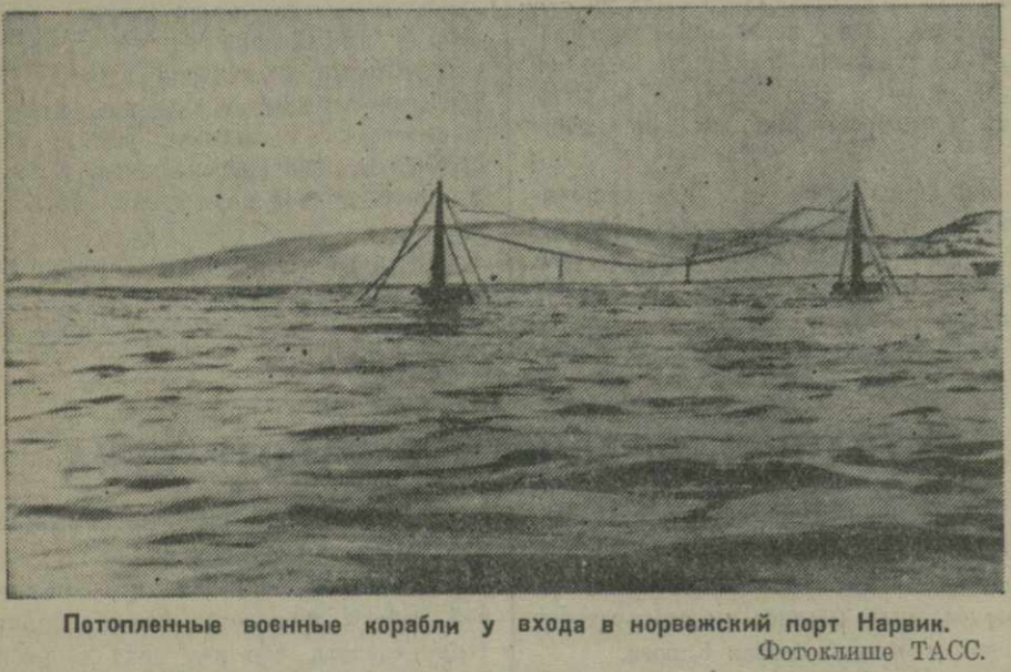
Потопленные военные корабли у входа в норвежский порт Нарвик.