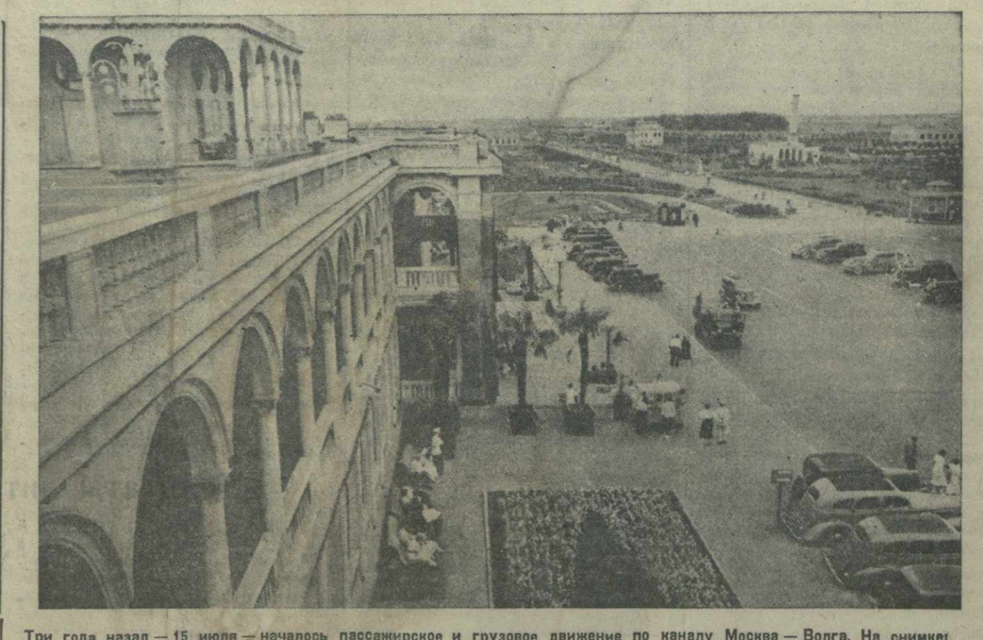
Три года назад — 15 июля — началось пассажирское и грузовое движение по каналу Москва — Волга. На снимке — под'езд и Химкинскому речному вокзалу канала в Москве.