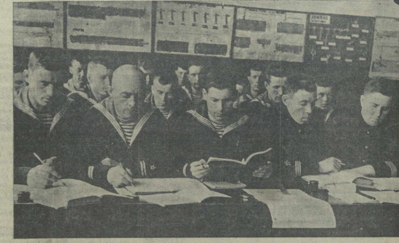
Учеба в Амурской Краснознаменной флотилии. На снимке: группа младших командиров на занятиях по истории партии.

Активное участие в подготовке к собраниям принимает заводская печать.