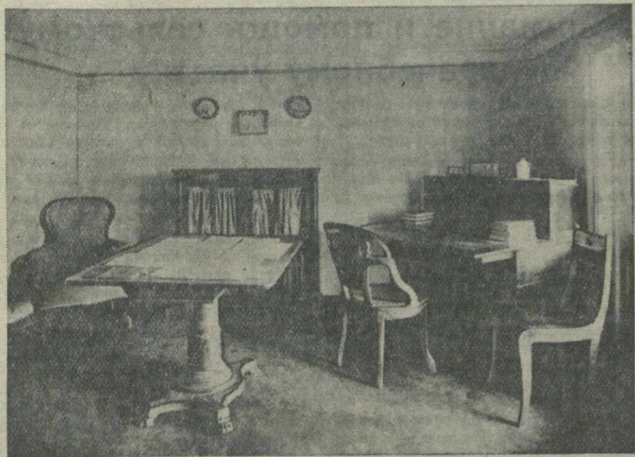
Комната Н. Г. Чернышевского в саратовском Доме-музее.

В Саратове, на правом берегу Волги, стоит небольшой дом, в котором родился и жил в молодости Н. Г. Чернышевский. В сентябре 1920 года декретом за подписью В. И. Ленина Дом-музей имени великого писателя-революционера был объявлен народным достоянием. Будучи одним из замечательных историко-революционных уголков Поволжья, он привлекает к себе внимание широких масс трудящихся, учащейся молодежи.