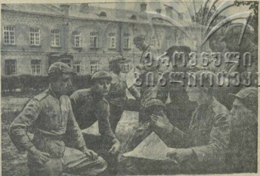
Группа солдат литовской народной армии обсуждает статьи, прочитанные в газете «Солдатская правда».