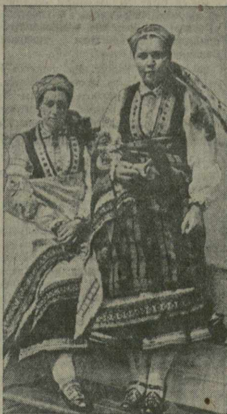
В Советской Латвии. На снимке: латвийцы в национальных костюмах.