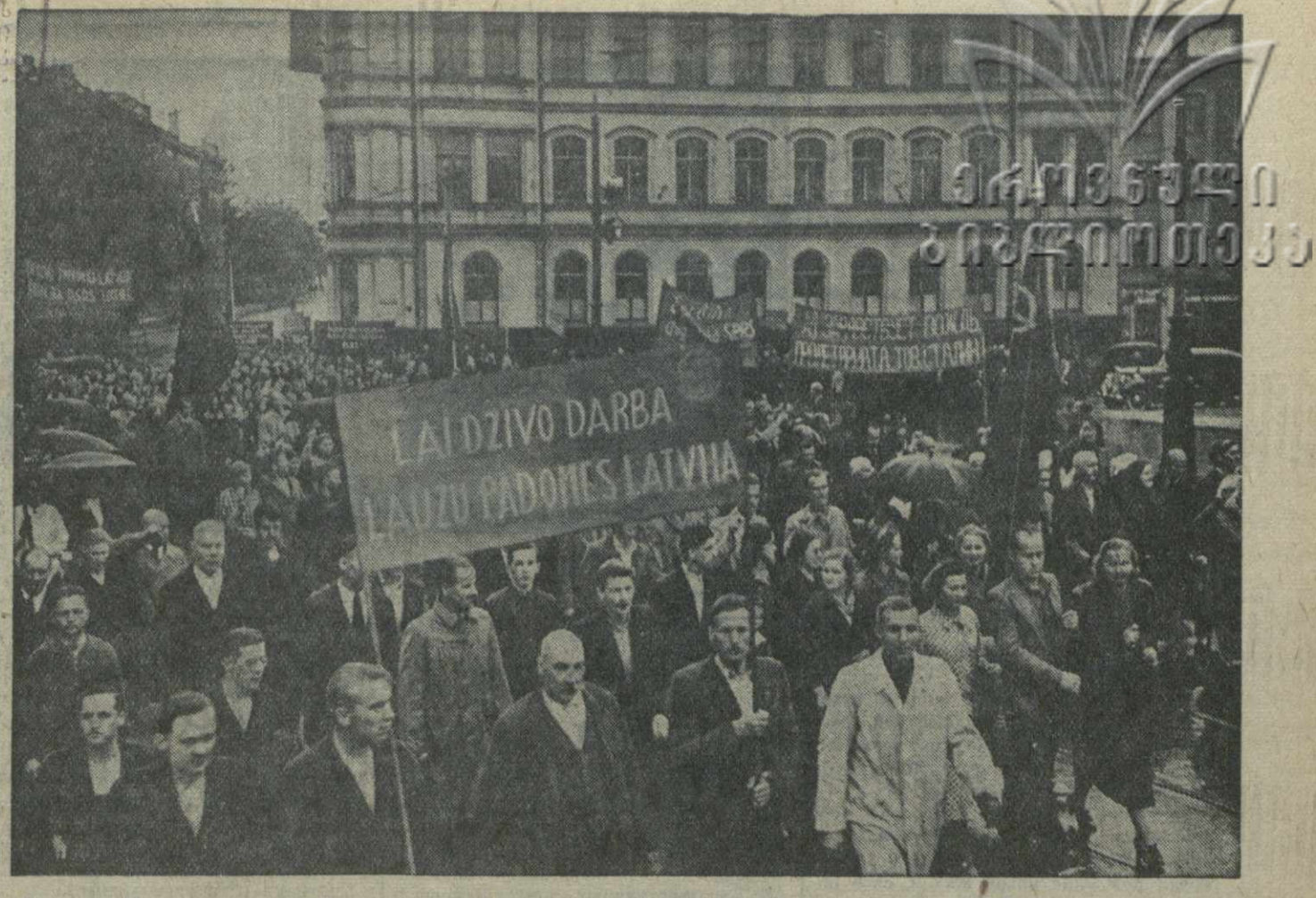
На днях в Риге состоялась 200-тысячная демонстрация в честь принятия Латвии в состав СССР. На снимке: демонстранты на улицах Риги.

ОТВОД АНГЛИЙСКИХ ВОЙСК ИЗ СЕВЕРНОГО КИТАЯ ТОКИО, 13. (ТАСС). Агентство Домей цуэн сообщает, что начался отвод английского гарнизона из Байнина, 40 из 50 английских солдат, охранявших здание английского посольства в Байнине, сегодня эвакуированы в Тяньцзинь со всем военным снаряжением. По имевшимся сведениям, 16 августа эти солдаты совместно со 120 английскими солдатами в Тяньцзинь отправятся в Гонконг.