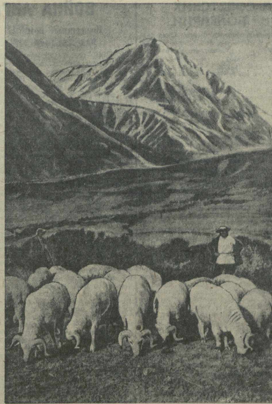
Отара овец колхоза села Зодехи на альпийских пастбищах Ленинградского района (Юго-Осетинская Автономная область). Вдали гора Микети.