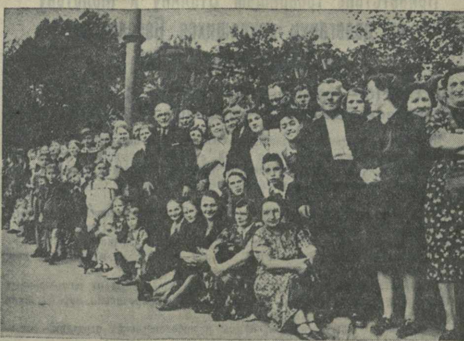
В Советской Латвии. Население Риги слушает на улицах радиопередачу из Москвы.