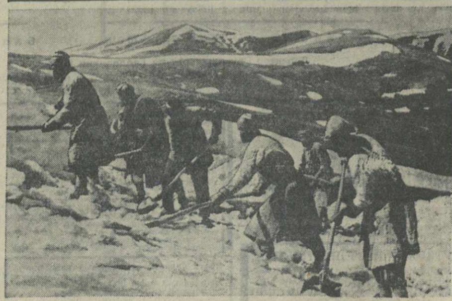
На строительстве Ново-Памирского транта. На снимке: расчистка снега на перевале. Работают колхозники Оби-Гармского района (Таджикистан ССР).

Итоги прений подвела секретарь райкома им. Берия т. Ю. Килишвили, тов. Н. Чарквани.